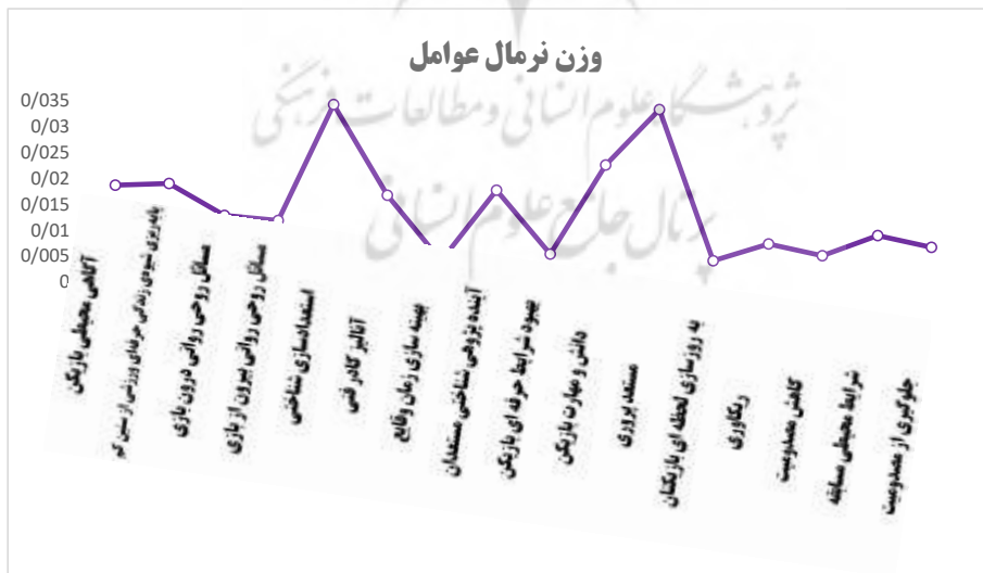
شکل ۲. وزن نرمال ابعاد فوتبال با رویکرد شناختی

وزن نرمال عوامل شانزده گانه در شکل ۲ نشان داده شده است.