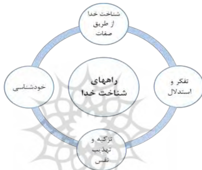
شکل ۲ راه های شناخت خدا

۴- خود شناسی : خدا شناسی را که مقدمه خودشناسی است را می توان از جهت دیگر موردتامل قرار داد، از آنجایی که فطرت آدمی با معرفت خدا عجین است، دعوت به خودشناسی در واقع دعوت به خداشناسی و ارتباط با خداست. امیرالمومنین علی (ع) می فرماید: خدایا تو قلب ها را با محبت به خود و عقل ها را با معرفت خود سرشته ای (مجلسی، ۱۴۰۳) بنابراین خودشناسی مقدمه محبت و معرفت به خداست.