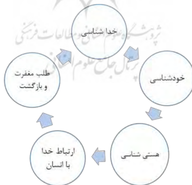
شکل ۱ مولفه های تاب آوری

خداشناسی: خداشناسی در لغت به معنای شناختن خداوند و ایمان به اوست. خداشناسی در اصطلاح به معنای اینست که انسان به حقیقتی برسد که درک کند خداوند علت و خالق اوست و او عین نیاز و متعلق به خداوند است. چنانکه در قرآن می فرماید: "يا أَيُّهَا النَّاسُ أَنْتُمُ الْفُقَرَاءُ إِلَى اللَّهِ وَاللَّهُ هُوَ الْغَنِيُّ الْحَمِيدُ". "ای مردم شما همگی نیازمند به خدایید، تنها خداست که بی نیاز و شایسته هرگونه حمد و ستایش است." خداشناسی در روایات و احادیث: پیامبر اکرم (ص) در نهج الفصاحه در باب خداشناسی می فرمایند: "أَفْضَلُ الْعَمَالِ الْعِلْمُ بِاللَّهِ إِنَّ الْعِلْمَ يَنْفَعُكَ مَعَهُ قَلِيلُ الْعَمَلِ وَكَثِيرُهُ وَإِنَّ الْجَهْلَ لَا يَنْفَعُكَ مَعَهُ قَلِيلُ الْعَمَلِ وَلَا كَثِيرُهُ" "بهترین اعمال، خداشناسی است. کاری که با علم قرین است، کم و زیاد آن نافع است و کاری که با جهالت قرین باشد، نه کم آن سود می دهد و نه زیاد آن (شبانکاری، ۱۳۹۸). خداشناسی سنگ اول دین است. همچنین خداشناسی سنگ اول آدمیت است و انسانیت و آدمیت و اخلاق بدون شناخت خدا معنا ندارد؛ یعنی هیچ امر معنوی بدون اینکه آن سر سلسله معنویات پایش به میان آید معنا ندارد (مطهری، ۱۳۹۲).