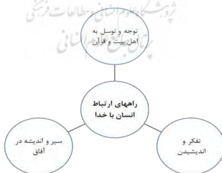
شکل ۵ راه های ارتباط انسان با خدا