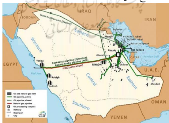
نقشه ۱. زیرساخت‌های نفت و گاز عربستان

فارغ از جایگاه ویژه عربستان و میزان دارایی نفتی این کشور چیزی که باعث اهمیت ویژه این کشور در بین صادرکنندگان نفت می‌شود موقعیت خطوط لوله نفتی عربستان نسبت به سایر همسایگان این کشور در خلیج فارس است.