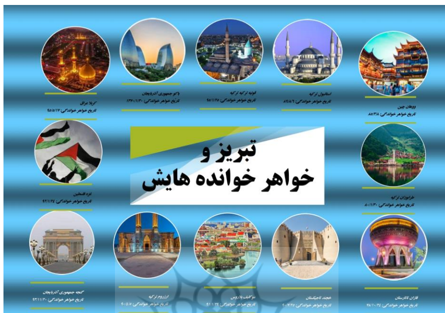
شکل ۱. تبریز و خواهر خوانده‌های آن