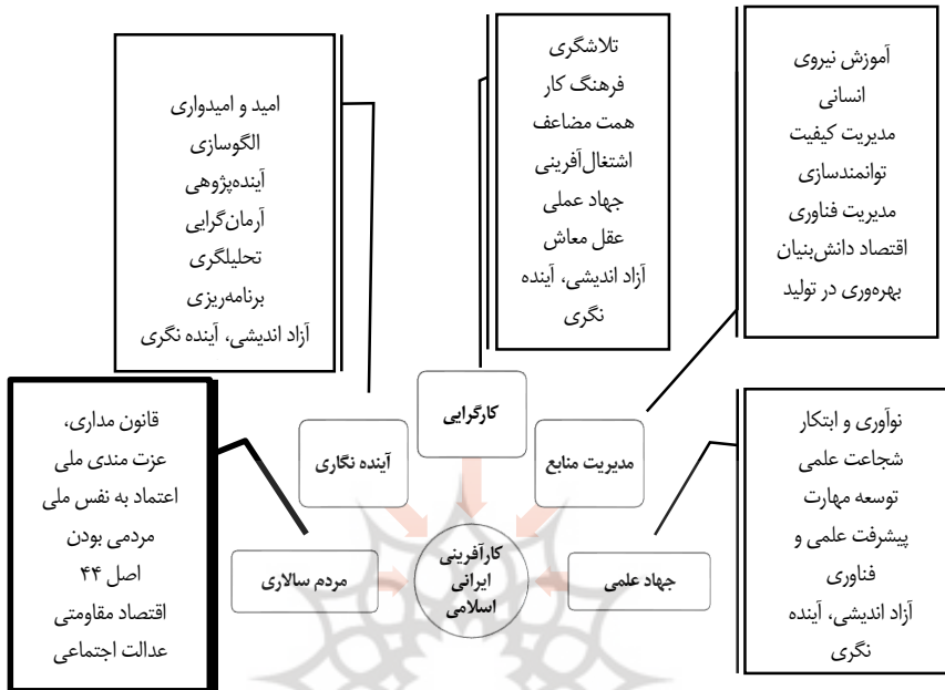
شکل ۱: الگوی مفهومی کارآفرینی اسلامی ایرانی

پوشش دهند. سرانجام شبکه مضامین الگوی کارآفرینی ایرانی - اسلامی در این شکل احصا شد.