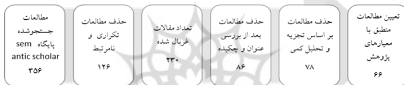
شکل ۲: فرایند انتخاب مطالعات براساس چک‌لیست PRISMA

در این فراترکیب، از مقاله‌ها و پژوهش‌ها براساس پروتکل Prisma، استفاده شده است که در شکل ۱ فرایند آن تشریح شده است. معیارهای پروتکل این اثر عبارت‌اند از: ثبت در پایگاه‌های علمی معتبر، ذکر عوامل مؤثر و پیامدها در حوزه قومیت و توسعه سیاسی. در پایان، باتوجه‌به موضوع، چکیده، پرسش، هدف و زمینه ارزیابی، ۳۵۶ پژوهش اولیه برای بررسی عمیق انتخاب شدند.