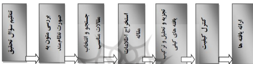
شکل ۱: گام‌های فراترکیب

مطالعه کیفی است که نتایج استخراج شده از دیگر مطالعه‌های کیفی با موضوع همانند و مرتبط با پرسش پژوهش را به منظور دستیابی به چهارچوب جامعی برای دربر گرفتن همه ابعاد مسئله، بررسی می‌کند. در فراترکیب نیاز است که پژوهشگر بازنگری دقیق و عمیقی انجام دهد و یافته‌های پژوهش‌های کیفی مرتبط را ترکیب کند. استفاده از فراترکیب مانند استفاده از نگرش نظام‌مند، نتیجه‌ای به دست می‌دهد که بزرگ‌تر از مجموع بخش‌هاست. به منظور تحقق این هدف، از روش هفت مرحله‌ای سندلوسکی و باروسو (۲۰۰۷)، استفاده شد که خلاصه مراحل آن در شکل نشان داده شده است.