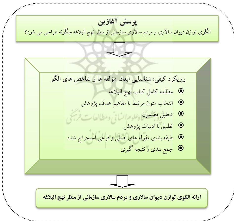
شکل ۱. مراحل انجام پژوهش

در این پژوهش با توجه به مطرح نمودن آن‌ها در پی ارائه الگویی است که بتواند در عین توجه به اصول بوروکراتیک به معیارهای مردم‌سالاری نیز در یک قاب یکپارچه توجه نماید و با ادغام آن با معیارهای اسلامی به یک الگوی نظام‌مند و چندبعدی از مدیریت اسلامی دست یابد. این الگو را می‌توان به بارزترین وجه در اصول مدیریتی و حکمرانی و شاخص‌های عملکردی و رفتاری امام علی (ع) از متون نهج‌البلاغه یافت که ضمن توجه به آن می‌تواند راهبردی برای ارتقای سطوح مدیریتی در کشور و نظام مقدس جمهوری اسلامی ایران باشد. در پژوهش حاضر پس از بررسی ادبیات پژوهش و ذهنیت اولیه از کلیت عوامل مربوطه، در چارچوب یک پژوهش کیفی مطابق با مراحل شکل زیر، فرایند انجام پژوهش صورت پذیرفت: