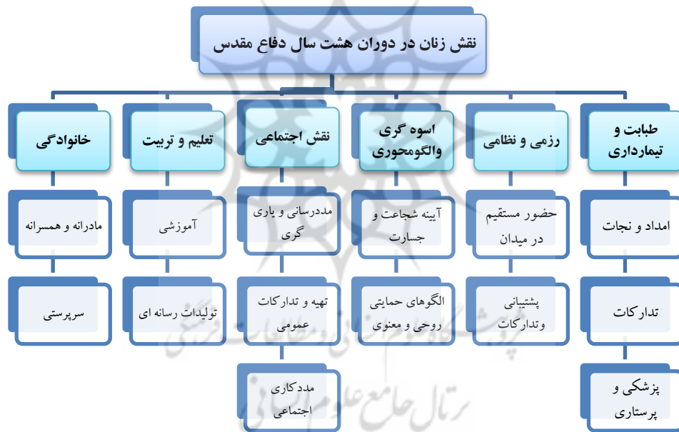
شکل ۱: نقش زنان در دوران هشت سال دفاع مقدس

حفظ ارتباط خانوادگی و ایجاد همبستگی بین اعضای خانواده تلاش می‌کردند. همچنین، این زنان با حمایت و پشتیبانی از همسرانشان در صحنه‌های نبردها و جنگ‌ها نقش مهمی در موفقیت این مبارزات داشتند و اگر اعضای از خانواده در جبهه مجروح یا جانباخت می‌شد، شیردلانه به مراقبت از آن‌ها می‌پرداختند. زنان پس از دست دادن پدر و سرپرست خانواده در زمان دفاع مقدس، باید نقش سرپرستی فرزندان نیز برعهده می‌گرفتند. آن‌ها باید می‌توانستند خانواده را به خوبی مدیریت کرده و از رشد و تربیت فرزندان در شرایط دشوار پس از جنگ مراقبت کنند. به‌طور کلی، زنان در دوران دفاع مقدس نقش مهمی در حفظ خانواده، حمایت از اعضای آن و مواجهه با چالش‌های زندگی در شرایط جنگ داشتند.