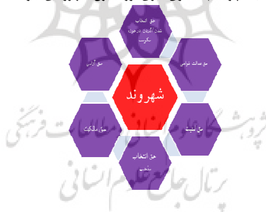
شکل ۲. پارادایم یا الگوی نظری دوره مدرن؛ شهروندی- دولت

بنابراین می‌توان گفت که همزمان با شکل‌گیری حکومت‌های مردمی و تعریف انسان‌ها به‌عنوان شهروندانی که در همه حوزه‌ها صاحب حق هستند و حکومتی نیز مشروع است که بر پایه خواست مردم باشد، شاهد روی کار آمدن پارادایمی با عنوان «شهروند- دولت» هستیم که در آن مردم از آزادی کاملی برای انتقاد و شیوه‌های مختلف اعتراض و مشارکت و بیان خواسته‌هایشان حتی به شکل رادیکال و براندازانه در مقابل دولت برخوردارند و دولت نیز موظف به حفاظت از حقوق و کمال افراد و ابتنا به خواست شهروندان است.