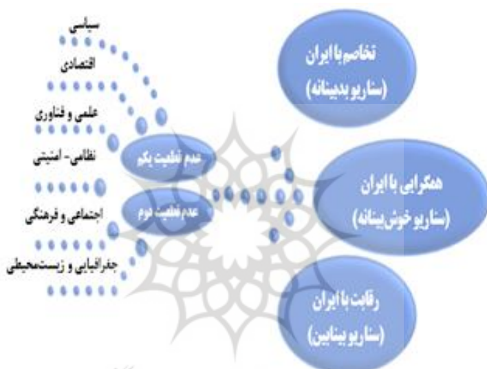
شکل شماره ۲- سناریوهای امنیتی محتمل جمهوری آذربایجان در رابطه با جمهوری اسلامی ایران

پالایش و تجزیه و تحلیل در نتایج پرسش‌نامه و رتبه‌بندی عوامل کلیدی و پیشران‌ها بر مبنای میزان اهمیت و عدم قطعیت و با توجه به نظر خبرگی تعیین شدند. دو عامل که از تأثیرگذاری و عدم قطعیت بالایی برخوردار بودند به‌عنوان دو عدم قطعیت کلیدی و عمده آینده‌ساز بین ج.ا. ایران و ج. آذربایجان انتخاب و نمودار شکل‌گیری فضاهای منجر به پیدایش سناریوهای بین دو کشور در سطح راهبردی ترسیم شد. سه سناریوی حاصل از فضاهای یاد شده با استفاده از ده عامل کلیدی و پیشران برتر احصاء و تجسم و سناریوهای امنیتی محتمل ج. آذربایجان در رابطه با ج.ا. ایران در قالب شکل زیر ترسیم گردید.