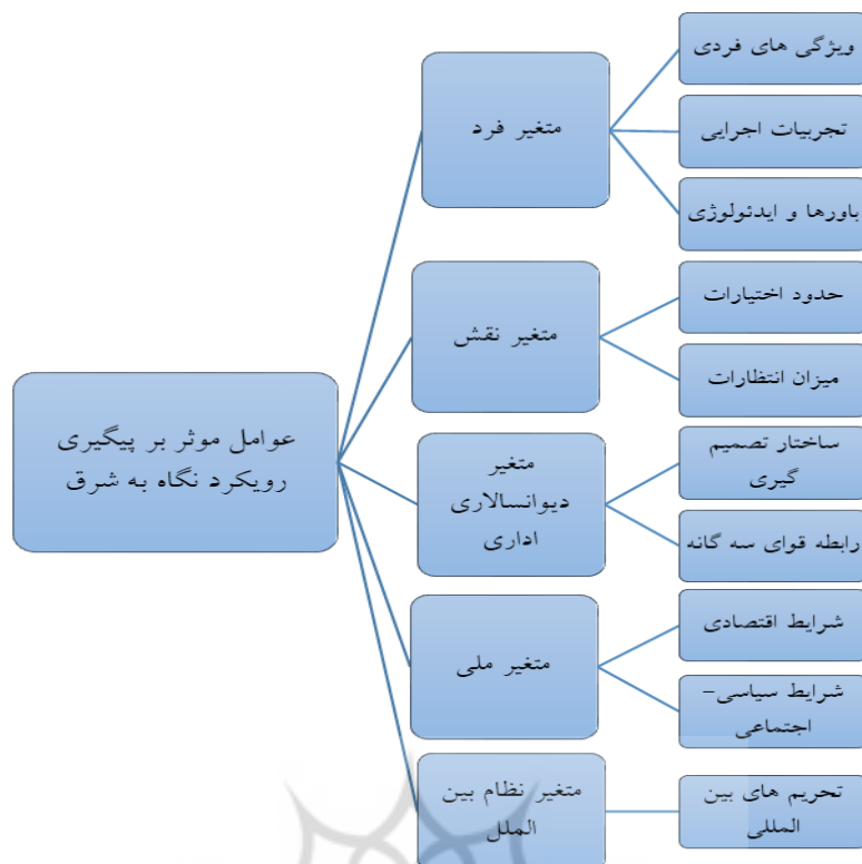
نمودار (۱): عوامل تأثیرگذار در پیگیری رویکرد نگاه به شرق در دولت سیزدهم

او اگرچه در ۵ سالگی پدر خود را از دست داد اما این امر موجب نگردید تا از تحصیل بازماند و تحصیلات ابتدایی را در مدرسه جوادیه و سپس تحصیلات حوزوی را در مدرسه نواب، مدرسه آیت‌الله موسوی‌نژاد مشهد و مدرسه آیت‌الله بروجردی (مدرسه خان) در قم پی گرفت (Raisi, 2022). آشنایی او در قم با امام خمینی (ره) و پیوستن به مبارزات سیاسی، از او شخصیتی انقلابی با گرایش‌های فکری سنتی و محافظه‌کار ساخت.