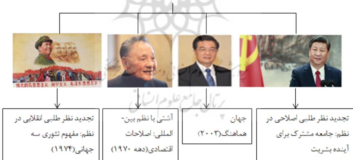
شکل (۱): چین و نظم بین‌المللی

موضع چین در قبال نظم بین‌المللی به سه دوره قابل تقسیم است: چین دوره مائو (نسل اول) که بر اساس تقسیم‌بندی بوزان یک کشور با رویکرد تجدیدنظرطلب انقلابی محسوب می‌شود. چین دوره دنگ شیائوپینگ (نسل دوم) که یک کشور طرفدار حفظ وضع موجود قلمداد می‌شود و چین بعد از دنگ شیائوپینگ (نسل سوم، چهارم و پنجم با کمی تفاوت در دیدگاه‌ها) تجدیدنظرطلب اصلاحی است. شکل شماره (۱) نوع نگاه نسل‌های مختلف رهبری چین به نظم بین‌المللی را نشان می‌دهد. این مقاله قصد بررسی همه دوره‌ها را ندارد و فقط بر دوره شی جین پینگ (نسل پنجم رهبری چین) تمرکز می‌کند.