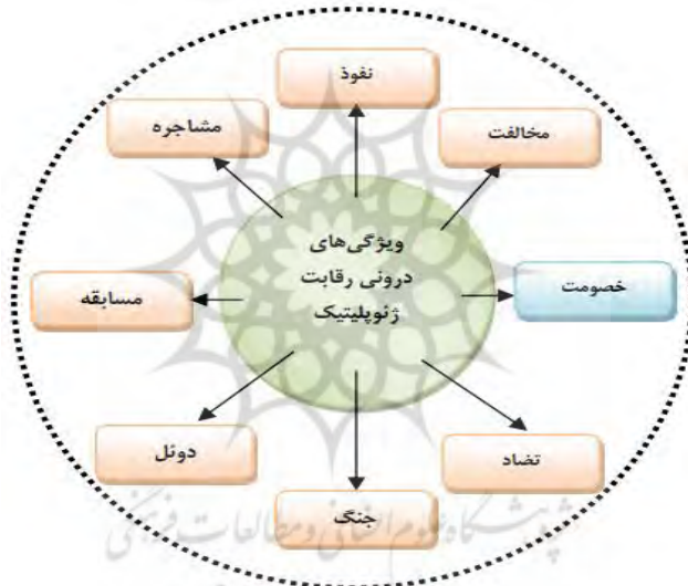
شکل ۱: ویژگی‌های درونی رقابت ژئوپلیتیک

خلأ قدرت برخوردار شود، مرزهای ژئوپلیتیک قدرت‌های پیرامونی یا فرامنطقه‌ای دچار انبساط شده و به داخل کشور یا فضای جغرافیایی ضعیف کشیده می‌شوند، و آن را به عرصه رقابت تبدیل می‌کنند. رقابت اقتصادی، این نوع رقابت در سطح دولت‌ها و کشورها براساس دسترسی به منابع و مواد اولیه و بازارهای مصرف تولیدات مربوطه و با هدف قطبی‌سازی و یکپارچگی اقتصاد جهانی انجام می‌پذیرد (حافظ نیا، ۱۳۸۵: ۳۷۰ - ۳۷۱).