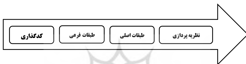
شکل ۶: روش بکارگیری رویکرد استقرایی در نظریه داده‌بنیاد (محمدی، ۱۳۹۹: ۱۹۵)

داده‌بنیاد معمولاً به سه شیوه اجرا می‌شود: شیوه سامان‌مند، شیوه نوحاسته و شیوه سازگار. در این مقاله از روش سامان‌مند که به استراوس و کوربین ۱ نسبت داده می‌شود برای تجزیه و تحلیل داده‌ها استفاده شده است. روش سامان‌مند خود دارای سه مرحله اصلی کدگذاری باز، کدگذاری محوری و کدگذاری انتخابی است. در این پژوهش، با استفاده از روش نظریه داده‌بنیاد پژوهش‌گر به دنبال آن است تا با یاری رویکرد استقرایی این روش پژوهشی در آخر به ارائه یک نظریه پردازد.