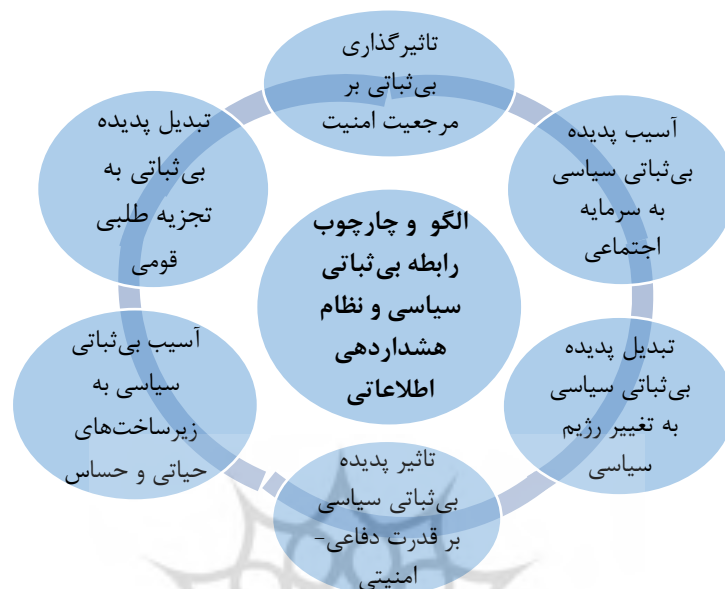
شکل ۷. الگوی به دست آمده از چارچوب بی ثباتی سیاسی و نظام هشداردهی اطلاعاتی (یافته‌های پژوهش)

بر اساس الگو و چارچوب تعیین شده برای بی ثباتی در نظام هشداردهی اطلاعاتی، چارچوب نظام هشداردهی اطلاعاتی نیز بر اساس نظر خبرگان، احصاء، جمع بندی و به شرح زیر ارائه شده است. بدیهی است، هر پدیده بی ثباتی با قرار گرفتن در ساختار تعیین شده این چارچوب، هشداردهی اطلاعاتی نسبت به موضوع یا پدیده بی ثباتی صورت خواهد گرفت.