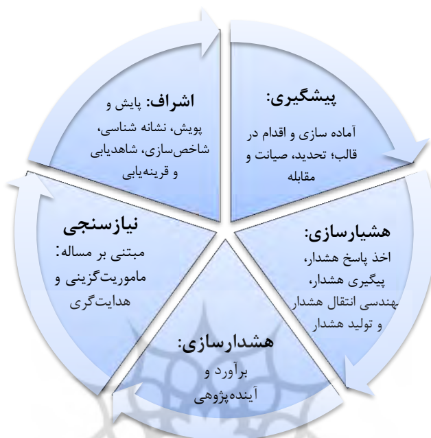
شکل ۸. چارچوب استاندارد ارائه نظام هشداردهی اطلاعاتی در بی‌ثباتی سیاسی (یافته‌های پژوهش)

با توجه به تعیین چارچوب بی‌ثباتی در نظام هشداردهی اطلاعاتی و تعیین چارچوب الگوی نظام هشداردهی اطلاعاتی مرتبط با پدیده‌های بی‌ثباتی سیاسی، روایی و اعتبار هر دو نیز در قالب امتیازاتی بین ۱ تا ۱۰ و با اخذ نظر خبرگان مورد ارزیابی قرار گرفت که نتایج نیز حاکی از تایید روایی و اعتبار یافته‌ها و به ویژه، چارچوب احصاء شده دارند.