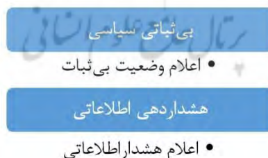
شکل ۸. نحوه اعلام هشداردهی اطلاعاتی با بی‌ثباتی سیاسی (یافته‌های پژوهش)

سازمان‌های اطلاعاتی عموماً وظایف ثابتی دارند که در اهداف مختلف کارکردهای خاص خود را به اجرا در خواهند آورد. در دیدگاه سنتی نقش سازمان‌های اطلاعاتی در ایجاد ثبات سیاسی محدود به شناسایی و سرکوب علل فاعلی بی‌ثباتی سیاسی بوده در حالی که نتایج این پژوهش نشان داد که تأثیر سازمان‌های اطلاعاتی به عنوان یک متغیر و یا عامل وابسته بر ثبات سیاسی تأثیرگذار بوده که در نحوه تعامل آنها با متغیرهای واسطه‌ای چون محرومیت نسبی فرصت‌های سیاسی - آنومی سیاسی - مشروعیت و... بروز و ظهور می‌یابد. سازمان‌های اطلاعاتی نه تنها در امور دفاعی و امنیتی ایفای نقش می‌کنند بلکه در مذاکرات تجاری و اقتصادی جبرائیم سازمان‌یافته بین‌المللی و بسیاری از امور داخلی و خارجی تأثیرگذار هستند. همان گونه که قبلاً اشاره شد؛ سازمان‌های اطلاعاتی دارای سه نقش؛ شناختی، اجرایی و نظارتی بوده، که به قطعیت می‌توان گفت وظیفه آنها در شناخت پدیده‌های بی‌ثباتی در هر سه نقش، قابل تعمیم و اجرا و پیگیری است. در شکل زیر، زمان اعلام شده در صورت وقوع بی‌ثباتی مشخص و ارائه شده است.