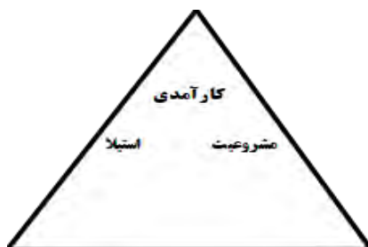
شکل ۱. مثلث ثبات سیاسی از دیدگاه ساندرز؛ مثلث ثبات (ساندرز: ۱۳۸۰، ۷۱)

گوشه فوقانی مثلث (کارآمدی) نزدیک تر باشد پایدارتر خواهد بود ولی احتمال وقوع بی ثباتی برای نقاطی که به گوشه چپ مثلث (استیلا) نزدیکترند بیشتر است (ساندرز: ۱۳۸۰، ۷۱).