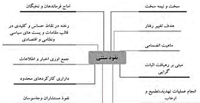
نمودار ۱: نفوذ سنتی