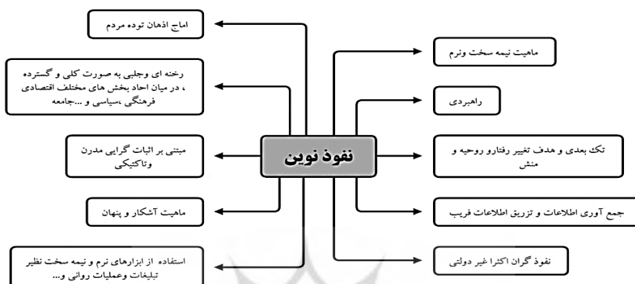
نمودار ۲: نفوذ نوین

فریب ۱ ، دیپلماسی عمومی ۲ ، تنوع نفوذگران اعم از دولتی و غیردولتی، افزایش کارکردهای سازمان‌های اطلاعاتی و ضد اطلاعاتی ۳ است. (همان، ۴۱-۴۴)