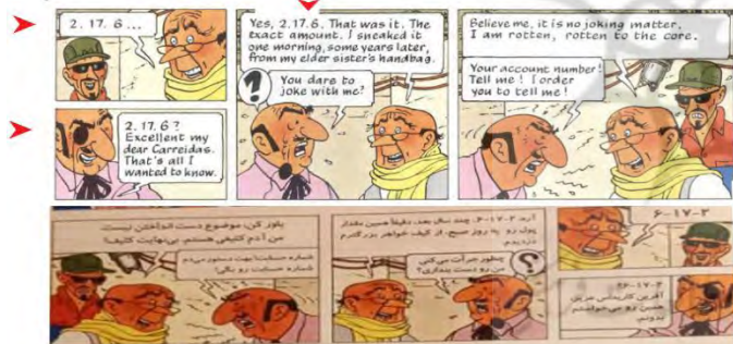
تصویر ۴. پرواز ۷۱۴ به سیدنی (ص. ۲۵)

در هر دو زبان فارسی و انگلیسی، جهت نوشتن اعداد از چپ به راست است؛ اما در تصویر ۴، در ترجمه این موضوع در نظر گرفته نشده است و با توجه به جهت‌های مختلف نوشتن زبانی، جهت «۲،۱۷،۶» تغییر کرده است و این عدد به «۲-۱۷-۶» در فارسی ترجمه شده که اشتباه است. همانند نظر یابلونسکی (۲۰۱۶) تغییراتی که در ترجمه تصاویر یا متن تن تن رخ داده در جهت هماهنگی و بومی‌سازی متون در جهت فرهنگ زبان مقصد بوده است.