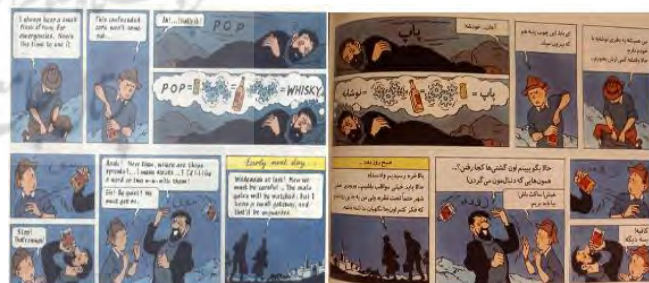
تصویر ۲. کوسه‌های دریای سرخ (ص. ۲۲)

در تصویر ۱، تن تن نوشیدنی الکلی نوشیده است و به همین دلیل بسیار خوشحال است و به شیوه‌ای غیرطبیعی عمل می‌کند. پروفسور از کاپیتان به دلیل دادن نوشیدنی به تن تن انتقاد می‌کند و به همین دلیل یک علامت سؤال در بالای سر کاپیتان که معمولاً الکل می‌نوشد وجود دارد. هیچ‌کس با خوردن نوشابه انرژی‌زا آن‌طور که تن تن رفتار کرده، عمل نمی‌کند. بنابراین، بین «نوشابه انرژی‌زا» در ترجمه (واژه Champagne در زبان مبدأ) و رفتار تن تن در تصویر عدم تطابق وجود دارد.