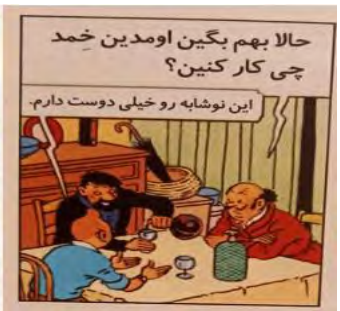
تصویر ۶. کوسه‌های دریای سرخ (ص. ۲۳)

در تصویر ۶، بخش‌های پررنگ و بزرگ‌تر در ترجمه باعث شده است که خواننده احساس کند این بخش نسبت به بخش دیگر متن اهمیت بیشتری دارد و تأثیر بیشتری بر خواننده ترجمه گذاشته، درحالی‌که در متن اصلی تمام قسمت‌های متن با اندازه یکسانی نوشته شده‌اند.