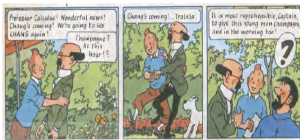
تصویر ۱. تن تن در تبت (ص. ۴)

در تصویر ۳، به دلیل جهت متفاوت نوشتن در زبان فارسی و انگلیسی، جهت چپ به راست نویسی در زبان انگلیسی به راست به چپ نویسی در زبان فارسی تغییر کرده است و به همین دلیل زمان نشان داده شده در ساعت، از ۱۱ به ۱ تغییر کرده است که متفاوت با زمان نوشته شده در ترجمه و متن مبدأ است. این یک عدم تطابق بزرگ بین متن و تصویر ایجاد کرده است؛ زیرا در متن اصلی یک بمب باید در ساعت ۱۱ منفجر شود درحالی‌که در ترجمه این زمان در تصویر ترجمه شده به ساعت ۱ تبدیل شده است.