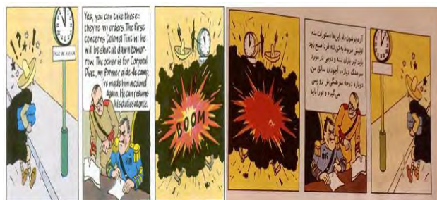
تصویر ۳. گوش شکسته (ص. ۳۶)

در موارد متعددی لغات مختلف ارجاع‌دهنده به «نوشیدنی الکلی» در زبان مبدأ با معادل «نوشابه انرژی‌زا/گازدار» در فارسی جایگزین شده‌اند. این درحالی‌ست که رفتار سرخوشانه شخصیت‌های کمیک، و یا تصویر بطری یا جعبه نگهدارنده نوشیدنی در متن مبدأ به نوشیدنی الکلی اشاره دارد. بنابراین، تغییر نوشیدنی الکلی با توجه به بافت تصویری و واژگانی‌ای که این واژه در آن قرار گرفته منجر به نقض رابطه بین متن و تصویر در ترجمه شده است. در ادامه، به چند مثال از این نوع تغییر و نقض اشاره می‌شود.