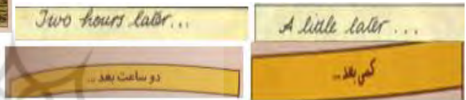
تصویر ۵. تن تن در تبت (ص. ۲۲)

در میان ترجمه‌های مورد بررسی، بیشترین تغییرات نوع/اندازه قلم در کتاب جزیره سیاه با ۸۵ مورد اتفاق افتاده است و کمترین به میزان سه مورد در پرواز ۷۱۴ به سیدنی اتفاق افتاده است و در هفت گوی بلورین هیچ موردی از این تغییر وجود ندارد. در ادامه چند مثال از این تغییرات ارائه شده است.