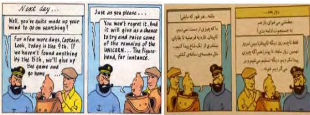
تصویر ۷. گنج راکهام سرخ‌پوش (ص. ۵۴)

از میان ترجمه‌های مورد بررسی، بیشترین مورد تغییر رنگ در گنج راکهام سرخ‌پوش با ۱۷۹ مورد و کمترین مورد در هفت گوی بلورین با ۲ مورد اتفاق افتاده است.