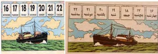
تصویر ۸. گنج راکهام سرخ‌پوش (ص. ۵۵)

در تصویر ۷، رنگ موهای تن تن و پیراهن کاپیتان در ترجمه تغییر کرده است.