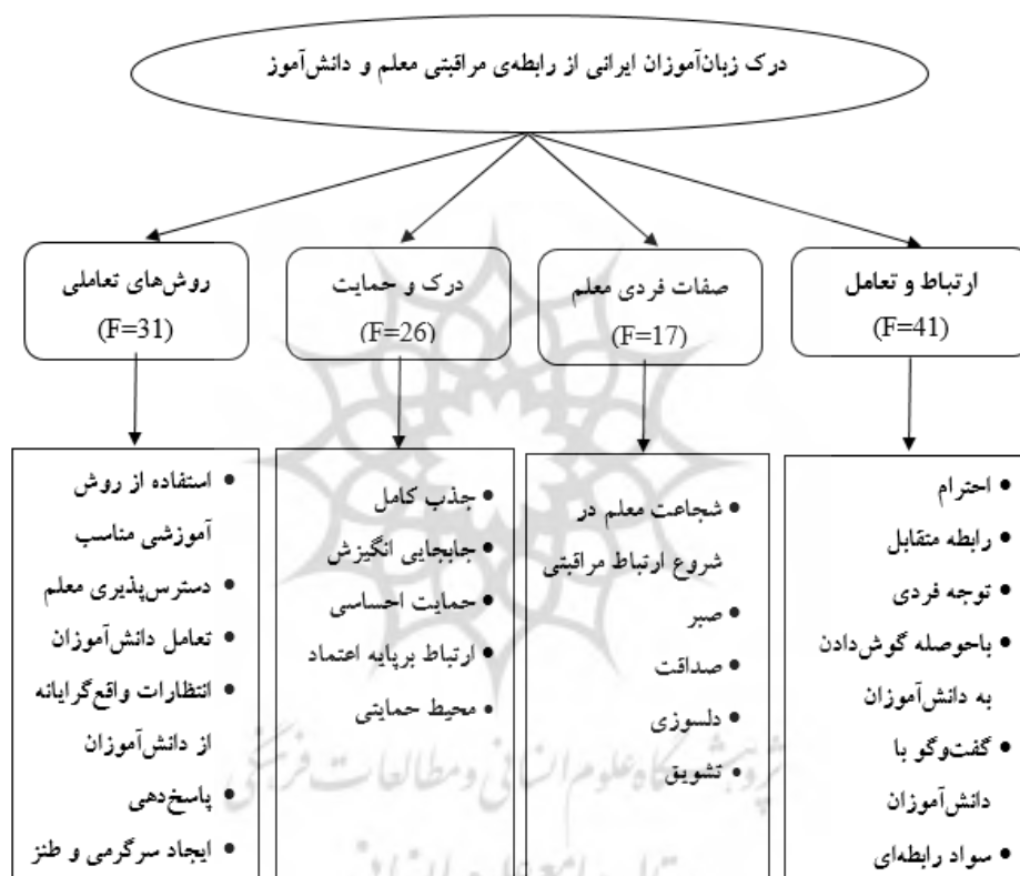
شکل ۴-۲ مدل پیشنهادی برای ارتباط مراقبتی معلم-دانش آموز از دید دانش آموزان

شامل ۱۱۵ کد بود؛ به عبارت دیگر، این موارد عواملی هستند که دانش آموزان ایرانی زبان انگلیسی به عنوان درک خود از روابط مراقبتی معلم-دانش آموز مشخص کرده اند. با بررسی ارتباط بین این کدها ۲۲ کد فرعی و ۴ کد اصلی شناسایی شد و یک مدل برای ارتباط مراقبتی معلم-دانش آموز از دید دانش آموزان پیشنهاد شد. شکل ۴-۲ بیانگر این مدل پیشنهادی می باشد. در این بخش فراوانی هر یک از مقوله ها به همراه سخنان شرکت کنندگان در تحقیق مورد بررسی قرار می گیرد.