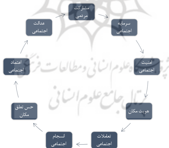
شکل ۳. مدل ساختاری تفسیری نهایی و نحوه ارتباط شاخص‌ها

در این مرحله از مدل‌سازی، سطح‌بندی شاخص‌ها نشان می‌دهد که تمامی آن‌ها در سطح ۱ اثرگذاری و اثرپذیری قرار دارند. این به این معناست که هر نه شاخص، هم به‌شدت برهم تأثیر می‌گذارند و هم از هم تأثیر می‌پذیرند و اولویت آن‌چنانی نسبت به هم ندارند. گام ۵) ترسیم شبکه تعاملات: در این مرحله با توجه به سطوح شاخص‌ها و روابط بین آن‌ها، شبکه تعاملات آن‌ها به شکل زیر ترسیم شده است: