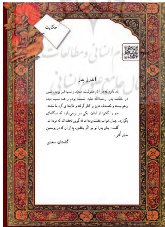
تصویر ۱. کاربری آرایه‌های بصری در کتاب فارسی هفتم.

در مراحل پیشرفته‌تر این عناصر بصری در قالب تصاویر و خط‌نگاره‌های مفهومی جلوه‌گر می‌شود. بررسی آرایه‌های بصری در کتاب‌های فارسی مقطع متوسط حاکی از کاربرد نسبی آرایه‌های بصری است. در کلیه دروس به موازات متن کتاب از نقوش طبیعت‌گرایانه، نقوش منطبق با متن و نقوش نمادین استفاده شده است. برای مثال، در پایان درس اول و بخش حکایت سعدی از گلستان، قایی از نگاره‌های ترسیم‌شده برای گلستان استفاده شده است. تصویر شماره ۱ این آرایه بصری را منعکس ساخته است.