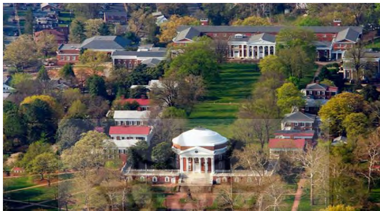
تصویر ۲. دانشگاه ویرجینیا