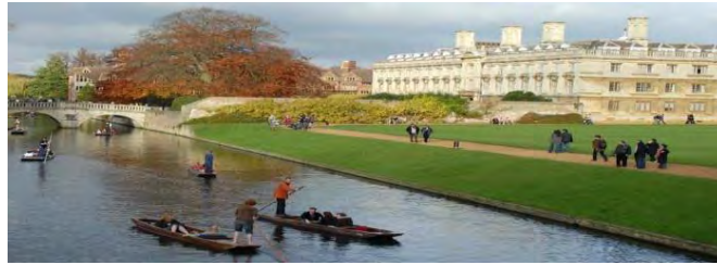
تصویر ۱. دانشگاه کمبریج که مردم در حال استفاده از فضای پردیس می‌باشند.