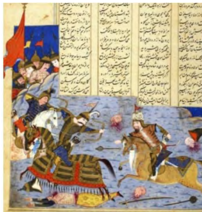
تصویر ۴. نبر رستم و رخش با دیوان. شاهنامه مصور. محل نگهداری: پاریس

- در عقاید توتیمیزم، حیوان توتیم از اعضای قبیله خود حمایت می‌کند؛ سیاوش در شاهنامه با حمایت اسب سیه‌فام خود بهزاد از ور عبور می‌کند و همراه با آن وارد خاک توران می‌شود، در هنگام مرگ به اسب سیه خود وصیت می‌کند و کیخسرو را به او می‌سپارد. پس از مرگ سیاوش هم، کیخسرو با همین بارگی از توران زمین می‌گریزد و با حمایت درواسپ - یزد نگهبان چارپایان - انتقام خون پدرش را از افراسیاب می‌گیرد (درواسپ یشت، کرده ۵ و ۶، بند ۳۸؛ ر.ک: پورداوود، ۲۵۳۶: ۲ / ۱۸۵؛ دوستخواه، ۱۳۸۵: ۱۸۵/۱). برخی از قبیله‌های توتیمیزم به داشتن بهترین نوع حیوان توتیم خود مشهور هستند و در اوستا خاندان سیاوش به جهت داشتن اسب‌های نیکو و تندرو معروف هستند (آبان یشت، کرده ۲۲، فقره ۹۸؛ ر.ک: پور داوود، ۲۵۳۶: ۱ / ۲۷۹). از دیگر نشانه‌های قبایل توتیمیزم ازدواج برون‌همسری است که در شاهنامه به صورت ازدواج سیاوش با جریده و منیژه جلوه‌گر است.