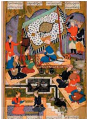
تصویر ۱. نگاره رودابه دختر مهرباب در باغ. شاهنامه پاریس

با قتل او گردید خود طاهر نیز چندی بعد از آن وفات یافت و عام مردم این مرگ‌ها را از تأثیر شوم قطع درخت سرو دانستند» (زرین کوب، ۱۳۸۴: ۳۶۷). تصویر شماره ۱ وجود درخت سرو در نگاره شاهنامه مصور پاریس را نشان می‌دهد.