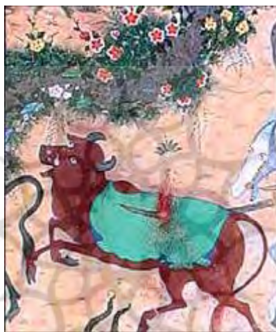
تصویر ۳. برمایه، شاهنامه طهماسبی، محل نگهداری: پاریس

- در بین قبایل توتمیک برای تمایز و برتری توتم‌ها ستیزهایی پیش می‌آمد، پیکار فریدون و ضحاک با توتم‌های متفاوت گاو و اژدها، نشانه‌ای از پیکارهای قبایل توتمیزم است. تصویر شماره ۳ گاو مذکور در شاهنامه را نشان می‌دهد.