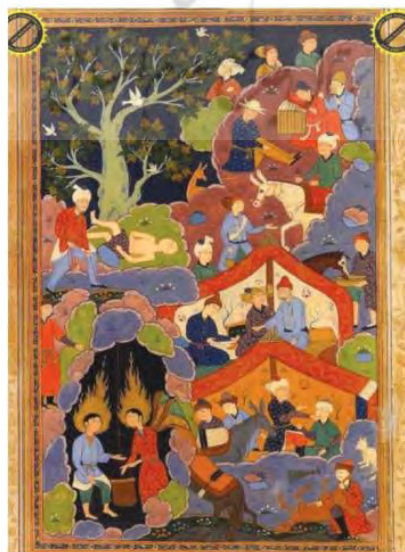
تصویر ۲. اسارات یوسف در چاه، دیوان حافظ. محفوظ در موزه دهلی نو

واژه اسیر از یک‌سو اشاره با زندانی گرفتار در بند دارد و از سوی دیگر، اشاره به شاعر سراینده (اسیر شهرستانی) دارد. در تصویر شماره ۲ از نسخه مصور حافظ نیز هنرمند توانسته به زیبایی مفهوم اسارت را ترسیم کند.