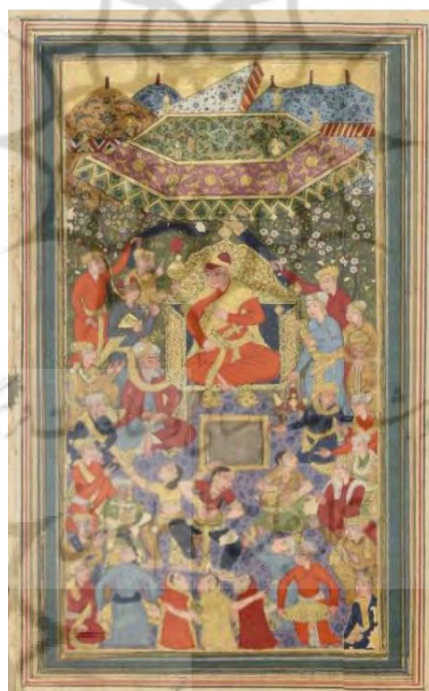
تصویر ۱. مجلس بزم. دیوان حافظ. محفوظ در موزه دهلی نو

در نگاره فوق، هنرمند به تصویرگری یک بزم و استفاده از نمادهای استعاره‌ای در رنگ و پوشش پرداخته است.