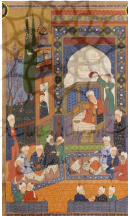
تصویر ۴. سرای پیر مغان. نسخه مصور حافظ. محفوظ دهلی نو

اسیر: بس که داریم آرزوی لذت بسمل شدن خون صید ما نخواهد گشت دانگیر دام (۳۵۵)