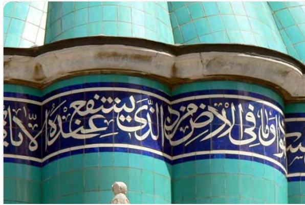
تصویر ۲. تزئینات کتیبه‌ای گنبد بقعه مولانا در قوینیه

نخستین ادعیه‌ای که از دور در بنای بقعه مولانا به چشم می‌خورد بر گنبد مخروطی شکل آن است که به شکل مدور دورتادور گنبد به خط نستعلیق نگاشته شده است. تصویر شماره ۲ این عبارت قرآنی و دعایی را منعکس ساخته است.