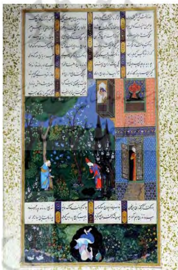
تصویر ۲. نگاره مرگ مرداس. شاهنامه شاه‌طهماسبی، محل نگهداری: موزه متروپولین