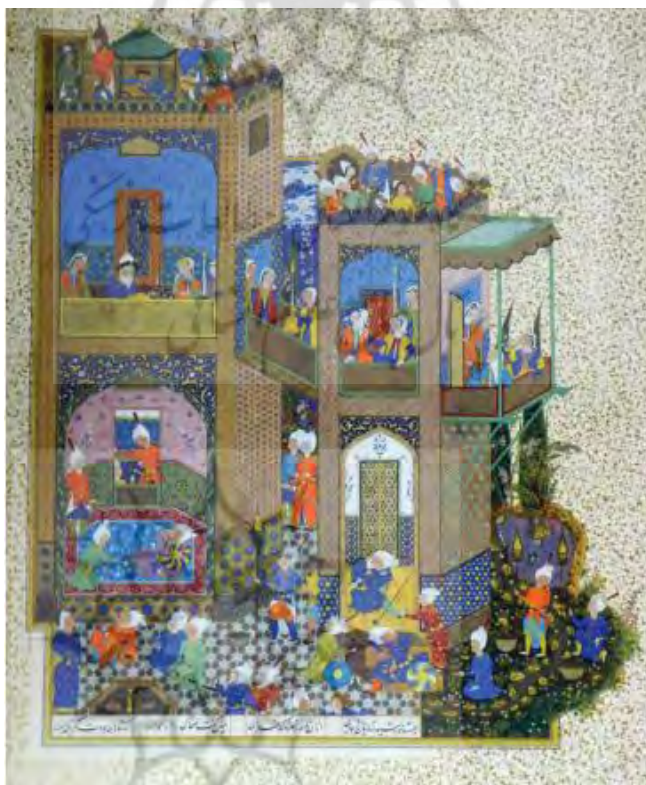
تصویر ۴. نگاره کابوس ضحاک، شاهنامه شاه‌طهماسبی. دوره صفوی، محل نگهداری: موزه متروپولین

کابوس شبانه و نام فریدون چونان بختکی بر زندگی ضحاک سایه می‌افکند. ترس، آرام و قرار را از او گرفته و او را وا می‌دارد که انگشت در جهان کرده تا مگر فریدون را بیابد. برای رهایی از این رویای هراس‌آور، چاره‌اندیشی‌ها می‌کند. افسر پیروزه، نماینده ترس‌ها و دلواپسی‌های اوست که تلاش می‌کند با نیروی ورجاوند سنگ پیروزه آن را از خود دور کند. خیام در نوروزنامه از باوری عامیانه درباره این سنگ گوهرین سخن می‌گوید که اشاره‌ای است به نیروی سپندینه آن در تسلاهی کابوس‌های ترس‌آور. او می‌نویسد: «و خاصیتش آن که چشم‌زدگی باز دارد و مضرت ترسیدن در خواب، و مرانگستری را به علامت فال و تعبیر رؤیا علامت‌هاست و در آن سخن‌ها گفته‌اند» (خیام، ۱۳۸۲: ۴۷).