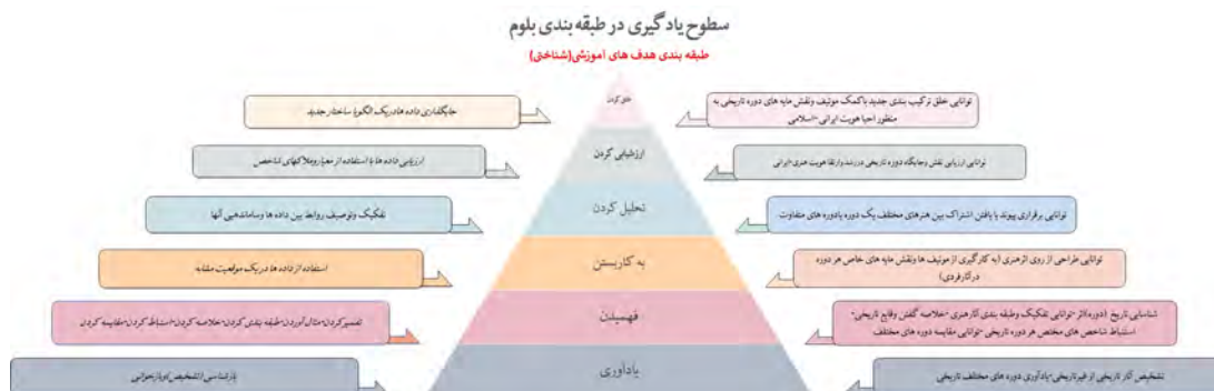
تصویر ۴ سطوح یادگیری در طبقه بندی بلوم، هدف‌های آموزشی، منبع: نگارندگان

نگرش هویتی حین آموزش است که کتاب وی را مخاطب صرف این امر خطیر دانسته است؟ در ادامه از منظر روش‌های آموزشی به این مقوله پرداخته می‌شود. تقریباً اکثر اهداف رفتاری هر فصل در سطح دوم طبقه‌بندی بلوم (دسته‌بندی کند، بیان کند، شرح دهد، بشناسد، شناسایی کند) باقی مانده (تصویر شماره ۳) و متناسب با هنرهای تجسمی همچون رشته‌های گرافیک، نقاشی و حتی هنرهای نمایشی، هدف‌های رفتاری متناسب با رشته تعریف نشده است (خواستن تکلیف یا پرسش در قالب المان‌های بصری می‌توانست بسیار راهگشا باشد). پرسش‌های پایانی هر فصل نیز متناسب با واحد نظری بوده که با توجه به رشته مخاطبین کتاب بهتر است بخشی از ارزشیابی در قالب سؤالات عملکردی طراحی شود. عدم ارتباط بین یادگیری‌های پیشین هنرجو و آموخته‌های جدید نیز قابل تأمل و بررسی می‌باشد. ارایه مطالب طوطی‌وار و پراکنده بدون ارتباط با یکدیگر تنها باعث انباشتگی داده در ذهن و مانع از تحقق یادگیری معنادار می‌شود. چراکه یادگیری زمانی معنی دار است که مطالب جدید رابطه منظمی با مطالب قبلاً آموخته شده داشته باشد یعنی