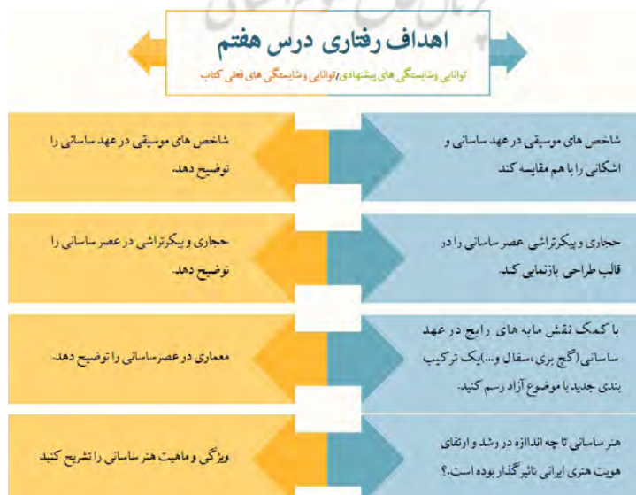
تصویر ۳. اهداف رفتاری درس هفتم