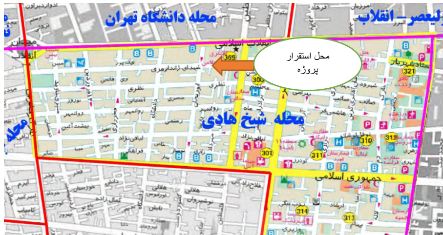
شکل ۱. جانمایی پروژه و خیابان‌های اطراف آن