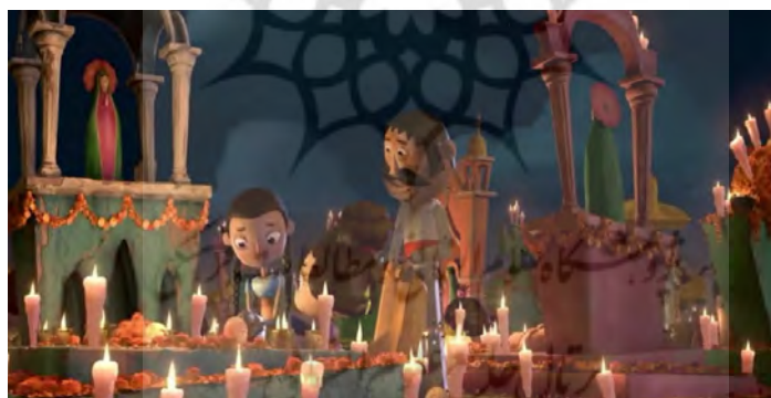
تصویر ۷. صحنه جشن روز مردگان و استفاده از گلبرگ های گل جعفری یا ماری و شمع بر مزار درگذشتگان