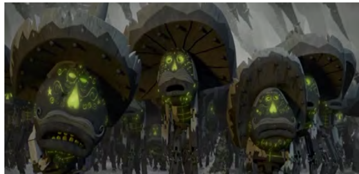
تصویر ۵. صحنه‌ای از نمایش دنیای ارواح فراموش شده که نمایش درگذشتگان به صورت ساکن، غمگین و بی‌روح است.