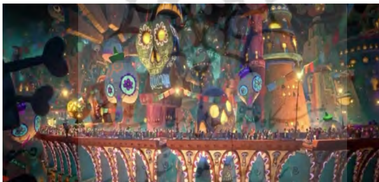
تصویر ۲. صحنه‌ای از مرگ مانولو و ورودش به دنیای ارواح که به خاطر سپرده شده است.

در فضاسازی انجام شده غالب رنگ‌ها گرم است نه رنگ‌های سرد و بی‌روح؛ زمانی که مادر یک لحظه ملایم‌تر و رمانتیک‌تر بود، از پالت رنگ‌های وسیع‌تری استفاده می‌کردیم اما زمانی که بازه زمانی در لحظات پرتحرک خیلی سریع کاهش می‌یابد، تضاد را افزایش می‌یابد و رنگ‌ها را کمی بیشتر محدود می‌کنیم تا این یک رنگ