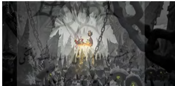
تصویر ۴. صحنه‌ای از نمایش دنیای ارواح فراموش شده که متوفی دیگر کسی در دنیا نباشد که به یاد او باشد.

یکی از نمادهایی که در انیمیشن کتاب زندگی نظر مخاطب