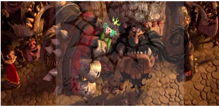
تصویر ۱۱. مربوط به سکانسی از حمله چاگال و ارتشش به شهر سن آنجل برای گرفتن مدال جاودانگی.

وی بر این باور بود که مرگ در واقع پایان حیات نیست بلکه یک انتقال است که به انسان کمک می‌کند تا از جهان مادی به سوی جهان روحانی پیش برود. در انیمیشن کتاب زندگی تأکید برای برقراری ارتباط با مرده‌ها و گفتگو با آنها یا در مورد آن‌ها می‌تواند هم‌راستا با آئین باشد و همچنین ناخودآگاه قادر است به از بین بردن ترس از مرگ یاریگر باشد.