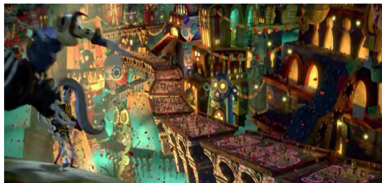
تصویر ۳. صحنه‌ای از نمایش دنیای ارواح که متوفی‌ها هنوز در دنیا کسی را دارند که به یادشان هست.