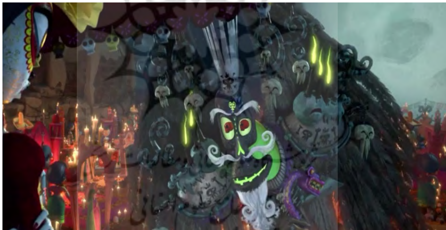
تصویر ۹. زیبالبا نگهبان سرزمین ارواح فراموش شده.

علامه جعفری معتقد است که مرگ مرحله ای است که همه انسان ها برای رسیدن به جهان دیگر باید از آن عبور کنند اما