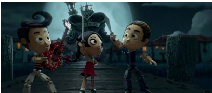
تصویر ۱. سه کاراکتر اصلی، مانولو (اولین کاراکتر از سمت راست)، ماریا (دومین کاراکتر از سمت راست)، خواکین (سومین کاراکتر از سمت راست).

در تحلیل دیدگاه علامه جعفری (رحمت الله علیه) می‌توان بیان کرد: مفهوم مرگ جامع است، و با وجود انواع موجودات شیوه‌های متفاوتی را دربر می‌گیرد و