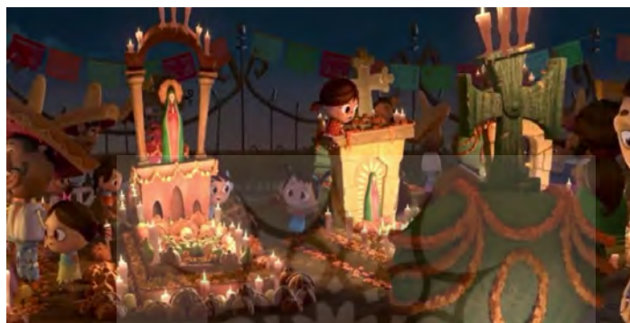
تصویر ۶. صحنه ای از جشن روز مردگان و قرارگیری نمادهایی مانند شمع، غذا، قاب عکس.

کودکان به دلیل داشتن تفکر غیر واقعی و ذهنی، مرگ را بازگشت پذیر تصور می کنند. در انیمیشن کتاب زندگی تلاش شده است، بازگشت ناپذیری مرگ را با بهره گیری از اعتقادات بومی مکزیکی برای کودکان به تصویر بکشاند (تصویر ۸).