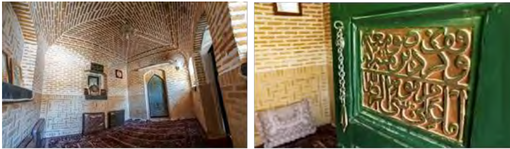
تصویر ۲: صومعه امام رضا (ع)؛ متن کتیبه‌های دو لنگه در آن عبارت است از: وقف کرد بر صومعه متبرکه که امام علی موسی الرضا/ میرک شربتدار فی تاریخ سنه ۹۳۷.