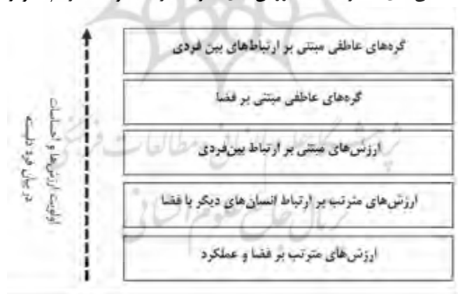
تصویر ۴: اولویت ارزش‌ها در بیان فرد دل‌بسته به مکان تاریخی

ارزش‌های مترتب بر ارتباط انسان‌های دیگر با فضا، ارزش‌های مترتب بر فضا و عملکرد (تصویر ۴).