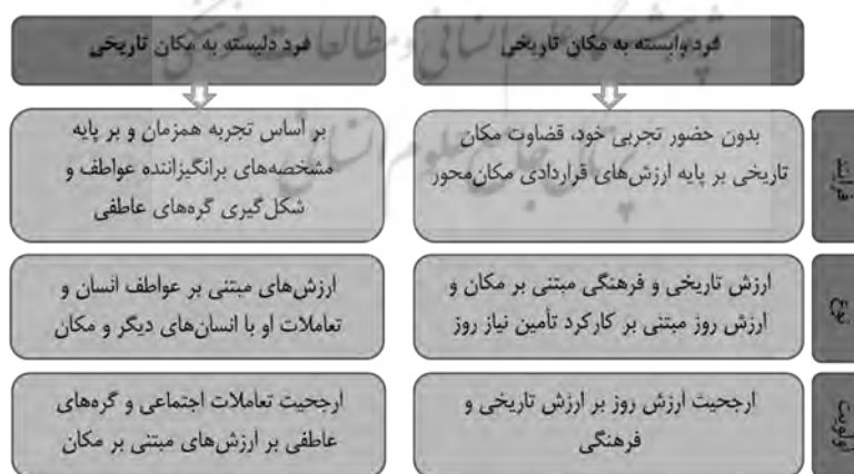
تصویر ۵: تفاوت ارزش‌های مکان تاریخی در نگرش فرد وابسته و دل‌بسته به مکان تاریخی

اولویت ارزش‌ها در نگرش فرد وابسته به مکان تاریخی با ارزش روز به‌عنوان انگیزه و اولویت اول تعهد نسبت به مکان تاریخی به‌عنوان فرصتی در قبال نیازهای حال و آینده از پیش تعیین شده است. در صورتی که در نگرش فرد دل‌بسته به مکان تاریخی، تعاملات اجتماعی و گره‌های عاطفی مبتنی بر این ارتباط که در و با فضا شکل گرفته در اولویت بالا قرار دارد و ارزش روز تعریف شده در نگرش فرد وابسته به مکان جایگاهی در اولویت‌های ارزشی فرد دل‌بسته ندارد.