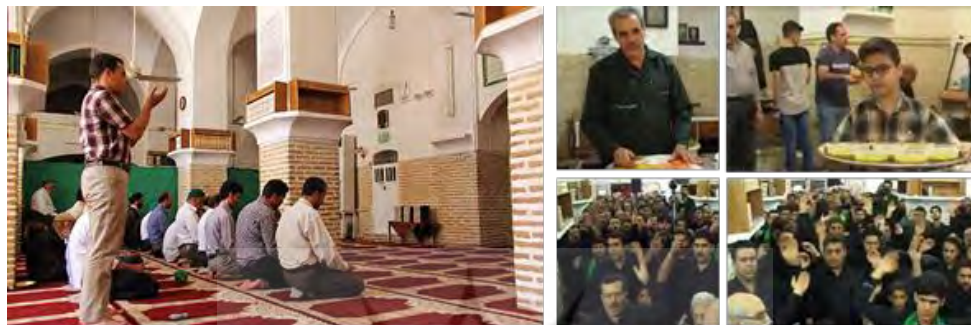
تصویر ۳: اقامه نماز؛ عزاداری دهه آخر صفر، به‌ویژه ۳۰ صفر، شهادت امام رضا (ع) و تهیه و پخش نذری

برای جمع‌آوری داده‌ها، با توجه به هدف پژوهش که مبتنی بر برداشت دانش، نگرش‌ها و باورهای افراد است، از شیوه مصاحبه (Rahman, 2015; Adekoya & Guse, 2020)؛ و به دلیل مشخص بودن سؤالات و ضرورت عدم اعمال نظر مستقیم پژوهشگر در بیان پاسخ‌ها، از نوع نیمه‌ساختاریافته استفاده شده است. با توجه به اینکه فرد دل‌بسته به مکان تاریخی ارتباط خود را با مکان در زمان حفظ می‌کند و همچنین اهمیت نوع بیان نظر افراد و تأکیدها و واکنش‌های غیرکلامی آن‌ها، مصاحبه با افرادی که در مکان حضور داشتند و به‌صورت چهره‌به‌چهره صورت گرفته است. برای تحلیل داده‌ها نیز با توجه به رویکرد کیفی پژوهش و با هدف آشکارسازی محتوای پنهانی و مضامین نهفته (Bartlett et al., 2023) در بیان مصاحبه‌شوندگان، از روش تحلیل محتوای کیفی که از راه فرایندهای طبقه‌بندی نظام‌مند، کدبندی و تم‌سازی به تفسیر ذهنی داده‌های متنی می‌پردازد (Hsieh & Shannon, 2005)، به‌صورت هدایت‌شده استفاده شده است. انتخاب مصاحبه‌شوندگان ۱۶ از طریق نمونه‌گیری هدفمند متوالی و با روش «نمونه‌گیری نظری» ۱۷ که در آن حجم نمونه آن‌قدر افزایش می‌یابد تا زمانی که دیگر کافی باشد (Banning, 2002; Adekoya & Guse, 2020)، استفاده شده است.