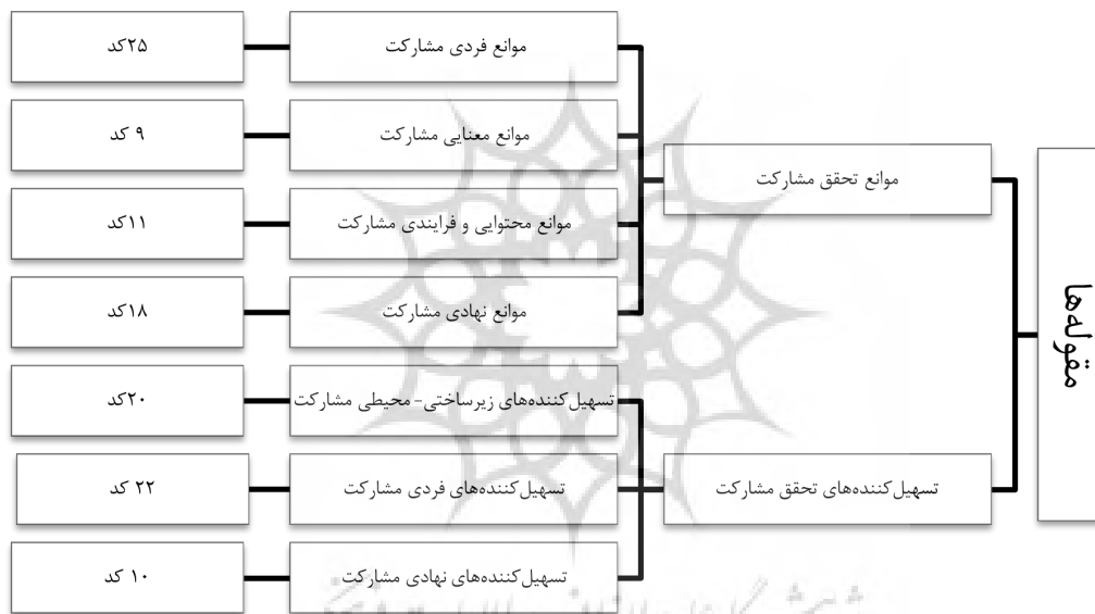
شکل ۲. اطلاعات مربوط به کدهای استخراجی

با مروری که بر منابع به دست آمده با توجه به موضوع پژوهش به صورت نظام‌مند صورت پذیرفت، مفاهیمی استخراج شدند که با بهره‌گیری از تحلیل محتوای کیفی، این مفاهیم (کدهای اولیه) تبدیل به زیرمقوله‌ها شدند و با تکیه بر هدف پژوهش در دو مقوله اصلی «موانع تحقق مشارکت» و «تسهیل کننده‌های تحقق مشارکت» طبقه‌بندی شدند. در مقوله اصلی نخست «موانع تحقق مشارکت» چهار دسته موانع به شرح «موانع فردی»؛ «موانع معنایی»؛ «موانع محتوایی و فرایندی»؛ و «موانع نهادی» و در مقوله اصلی دوم «تسهیل کننده‌های مشارکت» نیز سه دسته «تسهیل کننده‌های زیرساختی- محیطی»؛ «تسهیل کننده‌های فردی»؛ و «تسهیل کننده‌های نهادی» شناسایی شدند.