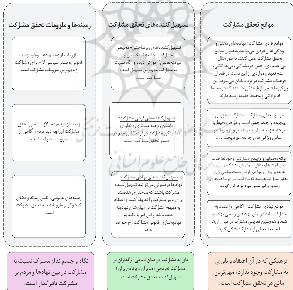
شکل ۳. مفهوم‌سازی موانع و تسهیل‌کننده‌های تحقق مشارکت

(و حتی پیش‌تر از آن در بستر خانواده) آمادگی لازم برای فعالیت‌های مشارکتی را کسب کنند. همچنین باید در نظر داشت که بستر کالبدی جامعه نیز برای گروه‌های خاص (مانند معلولان) مهیا باشد تا در صورت لزوم حضور فیزیکی برای مشارکت مانعی وجود نداشته باشد (Erfani & Roe, 2020; Gwaleba & Chigbu, 2020; Palar et al., 2019; Koch & Christ, 2018; Jomehpour & Behzad, 2020; Barclay & Klotz, 2019; Li et al., 2019; Rahmawati et al., 2014; Elbakidze et al., 2015; Caman et al., 2014; Ampatzidou et al., 2018; Stauskis, 2014; Harris & Roberts, 2003; Wong et al., 2020; Dnes et al., 2021). باید تمامی زیرساخت‌ها اعم از کالبدی و غیرکالبدی، مهیای تحقق مشارکت باشد. چه بسا بسیاری از گروه‌ها با وجود داشتن دغدغه‌های مشارکتی به دلیل نبود بستر مناسب، از فعالیت‌های مشارکتی جا بمانند و در جامعه نادیده انگاشته شوند. در نهایت لازم به ذکر است که مشارکت از آن دسته مفاهیمی است که ارتباط شدیدی با ویژگی‌های فرهنگی جامعه دارد؛ چراکه زمانی که سخن از مشارکت به میان می‌آید نوع کاربرد آن برای هر گروه و دسته‌ای متفاوت است و هر فرد براساس برداشت خود از مشارکت، توقعاتی را در ذهن خواهد داشت که به علت هماهنگ نبودن با سایر گروه‌ها تعارضاتی را در پی خواهد داشت. لازم به تأکید است که تحقق مشارکت در گروهی ایجاد بستری فرهنگی است. به منظور مشخص ساختن نگرش این پژوهش و با توجه به این امر که اساسی‌ترین فرایند علم، مفهوم‌سازی است (Sequeira, 2014)، با توجه به ابعاد و مقوله‌های شناسایی شده و مفاهیم مهم و پایه‌ای هریک از مقوله‌ها که از بررسی عمیق ۹۶ مقاله منتخب، به دست آمد، مدل مفهوم‌سازی پژوهش به شرح زیر است: