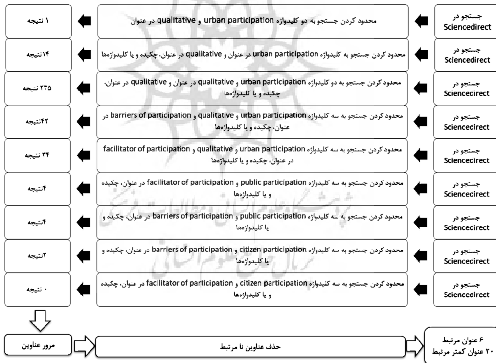
شکل ۱. نمونه فرایند انتخاب مقاله‌ها از پایگاه‌های داده منتخب پژوهش در science direct

در نهایت با مرور مقاله‌های به دست آمده از پایگاه‌های داخلی و خارجی ۱۴۸ مقاله انتخاب شدند و بعد از مرور تمامی مقاله‌ها، ۵۰ مقاله کمتر مرتبط کنار گذاشته شده و ۹۶ مقاله باقیمانده برای استخراج کدها مورد استفاده قرار گرفتند. برای بررسی تأییدپذیری، از کدگذاری توافقی ۲۳ استفاده شد و تمامی اعضای پژوهش در مورد همه کدها به توافق رسیدند، برای اطمینان از اعتبار پژوهش نیز یافته‌های پژوهش، توسط گروهی متشکل از ۶ تن از اساتید و دانش‌آموختگان ۲۴ حوزه برنامه‌ریزی شهری مورد بررسی قرار گرفت و نتایج تأیید گردید.