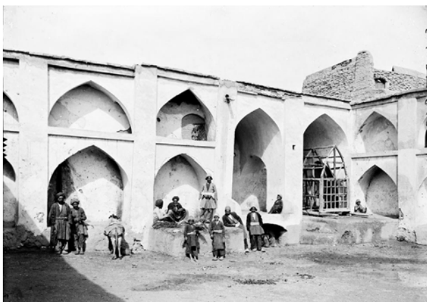
تصویر ۶. کاروانسرای تاریخی در جاده ابریشم، ایران. سفر سون هدین به ایران.

داشتند. آنها ایده‌ها و فناوری‌های جدیدی را از منطقه‌ای به منطقه دیگر معرفی کردند، مانند گسترش بودیسم از هند به آسیای مرکزی و بیشتر در چین (Liu, 2011; Chang, 2023). حرکت تجار همچنین گسترش ادیان را تسهیل کرد. بازرگانان اغلب در مناطق مختلف ساکن می‌شدند، جوامعی را ایجاد می‌کردند و بر فرهنگ‌های محلی تأثیر می‌گذاشتند (Liu, 2010; UNESCO, 2020a). افزون بر این‌ها تعاملات بین معامله‌گران باعث ایجاد حس اجتماعی در فرهنگ‌های مختلف شد. تجارت موفق به اعتماد و همکاری بین بازرگانان از پیشینه‌های مختلف بستگی داشت. معامله‌گران اغلب شبکه‌هایی را براساس خویشاوندی، دوستی یا انجمن‌های حرفه‌ای تشکیل می‌دادند که به کاهش خطرات مرتبط با تجارت از راه دور کمک می‌کرد (Christian, 2000; Gluhovic, 2024). بازرگانان اغلب زبان‌ها و گویش‌های متعددی را یاد می‌گیرند و آنها را قادر می‌سازد تا در مرزهای فرهنگی با یکدیگر ارتباط برقرار کرده و مذاکره کنند. این سازگاری زبانی برای تسهیل مبادلات و ایجاد روابط تجاری بسیار مهم بود (Norell et al., 2011).