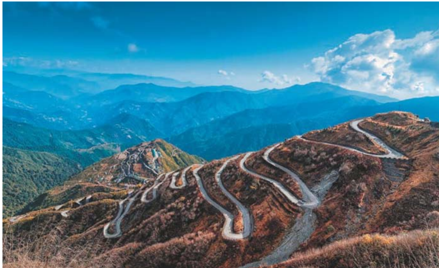
تصویر ۳. جاده‌های کوهستانی در مسیر قدیمی ابریشم بین چین و هند. © Rudra Narayan Mitra / Shutterstock.com. مأخذ: UNESCO, 2020a.