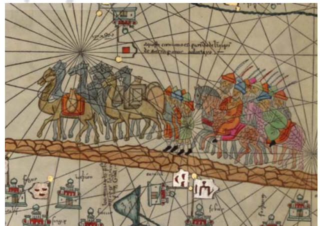
تصویر ۲. کاروان مارکوپولو در مسیر جاده ابریشم.