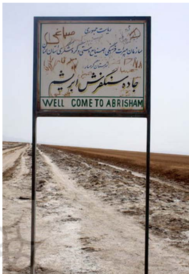
تصویر ۵. بخشی از مسیر جاده ابریشم در کویر گرمسار، سمنان.