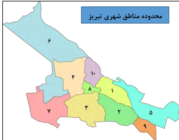
شکل ۲. نقشه مناطق شهری محدوده مورد مطالعه در شهر تبریز