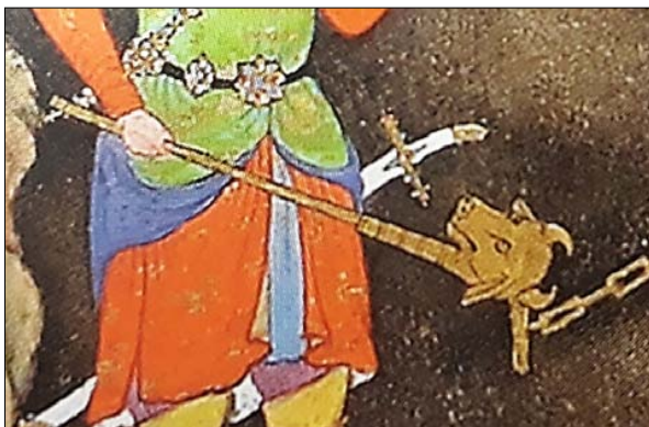
تصویر (۲)، جزئیات تصویر گرز گاوسر در نگاره‌ی گفتار اندر به بند کشیدن فریدون ضحاک را، اثر میر سید علی، مجلس بیست و چهارم، شاهنامه‌ی طهماسبی، ماخذ: (رجبی و دیگران، ۱۳۹۲: ۶۷)

Figure 2: Details of Image of the Gausar Mace in the Illustration of the Capturing of Zahhak by Fereydun, by Mir Seyyed Ali, 24th Assembly, Shahnameh of Tahmasbi. Source: (Rajabi et al., 2013: 67)