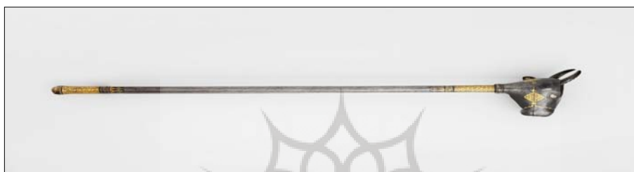
تصویر (۳)، گرز گاوسر، قرن نوزدهم میلادی، دوره‌ی قاجاریه، فولاد و طلا، اندازه اثر ۸۲٫۶ سانتی‌متر.

شده است. تزئینات طلائی اثر به شیوه‌ی طلا اندود یا زراندودکاری است. طلاکاری به روش‌های مختلفی انجام می‌شود. گاهی با گذاردن ورقه‌ی طلا بر روی فلز دیگر و کوبیدن ورقه طلا تا تثبیت شدن آن بر روی فلز پایه حاصل می‌شود که به آن کوفت‌گری طلا نیز می‌گویند. در شیوه‌ی دیگری از طلاکاری، لایه‌ی نازکی از زوروق یا ورق طلا بر روی سطح فلز دیگر گذاشته می‌شود و با اعمال حرارت و ایجاد اصطکاک و سایش و فشار، طلا بر سطح فلز تثبیت می‌گردد. نوعی دیگر از طلاکاری ملغمه‌کاری است. ملغمه مخلوط پودر طلا و جیوه است که توسط کاردک و ابزاری مناسب به صورت لایه‌ای نازک و ظریف بر روی سطح فلز پایه پهن می‌شود و سپس با اعمال حرارت، جیوه تیخیر و لایه‌ای نازک از طلا بر روی فلز پایه باقی می‌ماند. (دوامی، انعامی، ۱۳۹۵: ۱۰) با توجه به انواع شیوه‌های طلاکاری لازم به ذکر است که شیوه‌ی ملغمه‌کاری در دوره‌ی ساسانی وجود داشته و بعد از آن مشاهده نشده و منسوخ شده است. هم‌چنین در شیوه‌ی کوفت‌گری طلا وجود فرورفتگی برای کوبیدن فلز طلا در قسمت سطح اثر امری معمول بوده ولی در سطح گرز، این نوع فرورفتگی در نقاط طلاکاری شده دیده نمی‌شود. به نظر می‌رسد طلا نه با روش کوفت‌گری بلکه در ضخامتی بسیار ظریف و نازک و با اعمال حرارت و اصطکاک بر روی سطح اثر تثبیت شده است. تصویر (۳) نمایی از پهلو اثر را نشان می‌دهد: