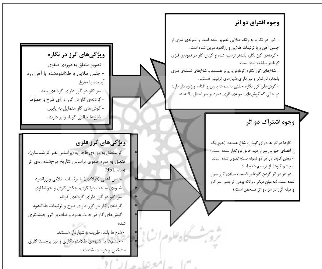
دیگرام (۳)، بررسی وجوه اشتراک و افتراق تصویر گرز گاو سر در نگاره‌ی به دار آویختن ضحاک و نمونه‌ی موزهی متروپولیتن

لوازم جنگی به دلیل اهمیت سختی و مقاومت در کارکرد آن‌ها، از جنس آهن و فولاد و با رنگ تیره ساخته می‌شده‌اند و البته نمونه‌های مفرغی (متماثل به زرد و طلایی) نیز موجود است. گرز در نگاره رنگی طلایی دارد و جنسی طلایی را به بیننده القاء می‌کند. به نظر می‌رسد رنگ طلایی گرز در نگاره یا نشان‌دهنده ماهیت مفرغین اثر است یا این‌که برای جلب توجه بیشتر مخاطب و به دلیل اهمیت بیان نمادین آن و تأکید بر ماهیت و وجود این سلاح در دست فریدون اتخاذ شده است و شاید هم آنچه نگارگر ترسیم نموده است گریزی آهنی با بدنه‌ای کاملاً زران‌دود شده است و نمونه‌ی واقعی آن موجود بوده و امروزه در دسترس نیست. به نظر می‌رسد قائل شدن ماهیت مفرغی با رنگ زرد و طلایی برای گرز منطقی‌تر و قابل قبول‌تر است. در شکل (۳) جزئیات وجوه اشتراک و افتراق تصویر گرز در نگاره و نمونه‌ی فلزی موزهی متروپولیتن نمایش داده شده است: