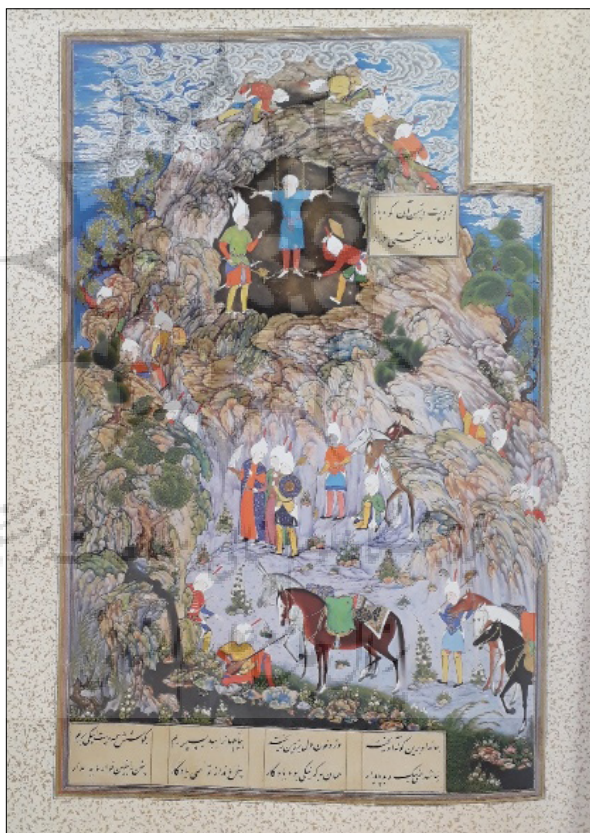
تصویر (۱)، نگاره‌ی گفتار اندر به بند کشیدن فریدون ضحاک راه اثر میر سید علی، مجلس بیست و چهارم، شاهنامه‌ی طهماسبی. ماخذ: (رجبی و دیگران، ۱۳۹۳: ۶۷) Figure 1: The Illustration of the Scene Depicting the Capturing of Zakhak by Fereydun, by Mir Seyyed Ali, 24th Assembly, Shahnameh of Tahmasbi. Source: (Rajabi et al., 2013, p. 67)

با توجه به محتوای اشعار و تقابل واژگان نیک و بد می‌توان نوعی دوگانه‌انگاری و ثنویت‌پنداری از اشعار برداشت کرد. به بیان دیگر "روایت فردوسی از جنگ بین خیر و شر که بعد از سال‌های طولانی حکمرانی شر بر جهان، در نهایت خیر پیروز می‌شود، همین‌که سرورش خجسته دست فریدون را در کشتن ضحاک باز نمی‌گذارد و مانع او می‌شود نشان از قدرتی حاکم بر هر دو سوی این منازعه دارد." (بنی‌اسدی، ۱۳۹۳: ۲۳) در واقع این دوگانه‌انگاری در دو جبهه‌ی خیر یعنی فریدون و شر یعنی ضحاک نمود پیدا کرده است و حکم به بند کشیدن ضحاک و کشته نشدن او به تداوم کار جهان اشاره دارد.