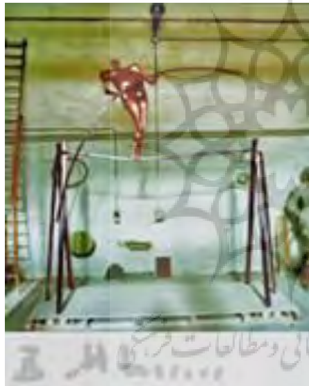
تصویر ۱۰. «بندباز»، برنز و فولاد، ۳۰۰×۳۵۰×۵۰۰ سانتیمتر، ۱۳۵۷. منبع: خلعتبری، ۱۳۹۶، ۷۶.