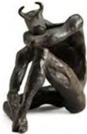
تصویر ۸. «مینوتور»، برنز، منبع: Mohassess, 2007.