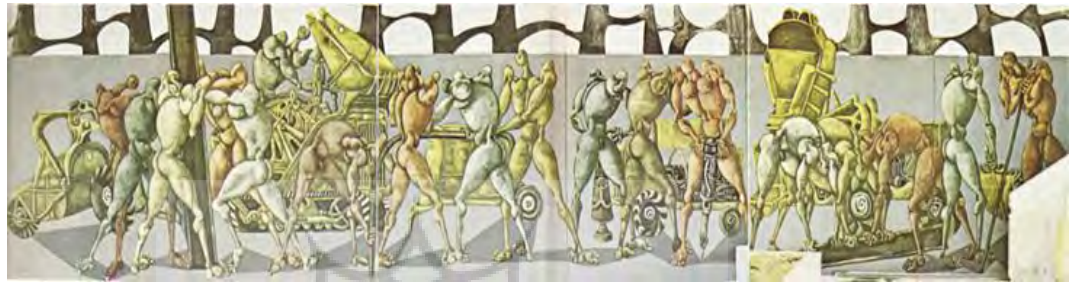
تصویر ۳. «روبو و مکانو»، رنگ و روغن و ترکیب مواد روی نئوپان، ۱۳۴۷.

که می‌شنود» ساخت. این مستند فیلمی است کوتاه از یک شب زندگی بهمن محمص که در آن هنرمند از عقایدش صحبت می‌کند. او خود را برای ایران پرسوناژی تاریخی عنوان می‌کند و درونمایه آثارش را «محکومیت به وجود» می‌داند. در سال ۱۳۴۷ در دومین جشن هنر شیراز محمص با چند تابلوی برجسته حاضر می‌شود که مهمترین آن‌ها «روبو و مکانو» است. این تابلو که در تصویر ۳ مشاهده می‌کنید، فیگورهایی درهم‌تنیده است که به فعالیتی مکانیکی مشغول هستند. اثری با ابعاد بسیار بزرگ که در آن کارگران ربات‌شکلی درهم‌تنیده‌اند. عضلات و اندام‌هایشان بزرگ اما سرهایی کوچک دارند که قدرت تفکر را از آن‌ها سلب می‌کند. رنگ‌هایی کدر و کثیف که نشان از پوسیدگی و زنگ‌زدگی فضای نقاشی دارد.