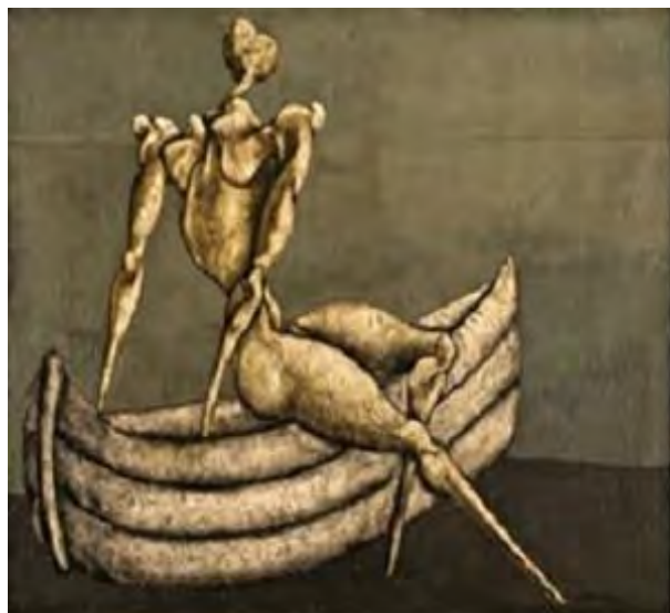
تصویر ۲. «مردی کنار قایق»، رنگ و روغن روی بوم، ۱۵۰×۱۰۰ سانتیمتر، ۱۳۴۵. منبع: خلعتبری، ۱۳۹۶، ۲۱۵.