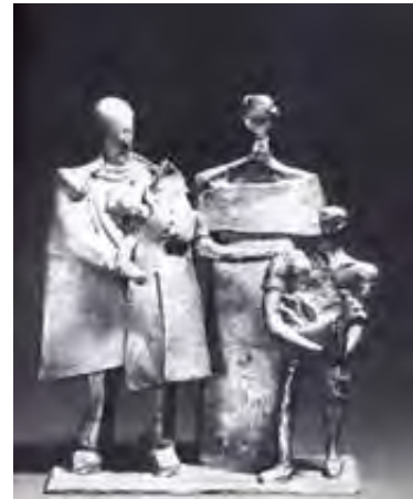
تصویر ۴. «خانواده سلطنتی»، برنز، ۲۵۰×۳۰۰×۱۵۰ سانتیمتر، ۱۳۵۱.