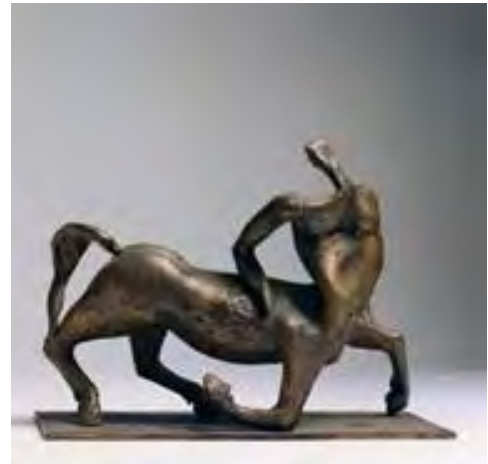
تصویر ۷. «سانتور»، برنز.