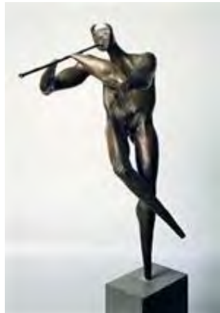
تصویر ۵. «نی لبک نواز»، برنز، ۲۰۰ سانتیمتر، ۱۳۵۲-۵۳. منبع: خلعتبری، ۱۳۹۶، ۶۲.