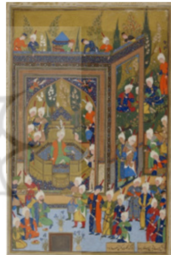
تصویر شماره ۱. نشست خسرو به جای پدر به پادشاهی و رفتن شیرین نزد مهین بانو، آقامیرک، ۹۴۹-۹۴۵ ه.ق. (URL1).