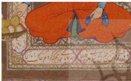
تصویر ۹. بخشی از تصویر ۳.

بیت شعر دیگری در محل جلوس شاه، از آهی ترسیزی جغتایی با مضمون عاشقانه و شاید کارکردی مدیحه‌گویانه در باب حضور شاه در محفل بزم، نوشته شده است. شاعر این بیت از امرای جغتای و شاعران دربار غریب میرزا، پسر سلطان حسین باغرا بوده که در ۹۲۷ ه.ق در تبریز درگذشته است (مدرس تبریزی، ۱۳۶۹: ۶۶). که با توجه به تاریخ و محل فوت وی، احتمالاً در اواخر عمر در دربار صفوی نیز شناخته شده بوده است. متن این بیت: دو چشمم فرش آن منزل که سازی جلوه‌گاه آنجا بهر جا پانهی خواهم که کردم خاک راه آنجا