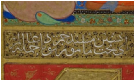
تصویر ۷. بخشی از تصویر ۲.