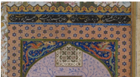
تصویر ۸. بخشی از تصویر ۲.