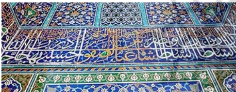
تصویر شماره ۵. کتیبه‌ای در صحن اصلی بقعه‌ی شیخ صفی‌الدین اردبیلی.