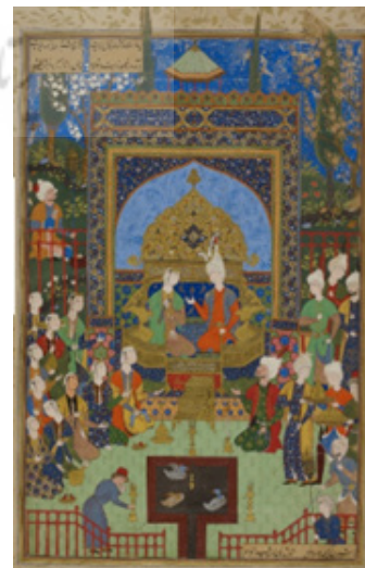
تصویر شماره ۲. دیدار خسرو و شیرین در نخجیر، آقامیرک، ۹۴۹-۹۴۵ ه.ق. (URL2).