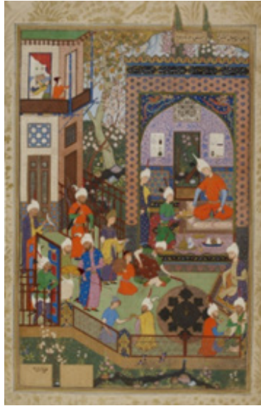
تصویر شماره ۳. بر بطن نوازی باربد نزد خسرو، نگارگر ناشناس، ۹۴۹-۹۴۵ ه.ق. (URL2).

با شاه تهماسب، ایجاد ارتباط معنای لغوی میان نام تهماسب و یکی از عناصر روایت خسرو و شیرین (شبدیز) می‌باشد. در متن خمسه‌ی نظامی، از علاقه‌ی بسیار خسرو به شبدیز (اسب شیرین که در ابتدای داستان دلداگی آنها، او را همراهی می‌کند و بعد از وصال آن دو، متعلق به خسرو می‌شود) یاد شده است. همچنین از او به عنوان یکی از پیش‌گویی‌های به وقوع پیوسته در زندگانی خسرو که توسط نیای خود خسروانوشه‌روان در خواب به او الهام شده، اشاره می‌شود. از طرفی معنای لغوی نام تهماسب که در زمره‌ی نام‌های ایرانی و شاهنامه‌ای قرار می‌گیرد، «دارنده‌ی اسب تنومند» است که این ارتباط معنایی نیز در نوع خود به جذابیت این جابه‌جایی میان دو