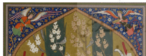
تصویر ۶. بخشی از تصویر ۱.