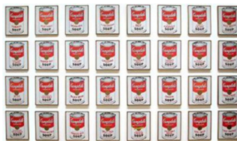
تصویر ۵. قوطی‌های سوپ کمبل، اندی وار هول پلیکر ترکیبی روی بوم، ۱۹۶۲، موزه هنر مدرن نیویورک. (URL4).

افراد بی‌احساسی که در موقعیت‌های عاطفی قرار می‌گیرند، باز‌نمایی‌هایی از نحوه مدیریت دقیق او در دنیای خود بودند. دو اثر «اوایل صبح یکشنبه» (تصویر ۷) و «نایت‌هاوکز» ۲۶ (تصویر ۸) صحنه‌هایی از روستای