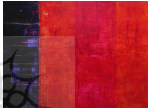
تصویر ۱۰. رازل دازل، دونا ویلیامز (URL3).