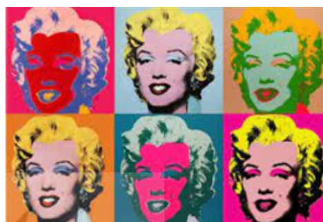
تصویر ۶. مرلین مونرو، اندی وار هول ۱۹۶۷ (URL6).

همچنین فیتز جرالدها به‌نقل از دوست وار هول، چارلز لیسانبی، می‌نویسد: «اندی اصلاً نمی‌دانست که می‌خواهد با هنر چه کند. او تمرکز کامل نداشت. با این حال او انگیزه خلاقانه برای انجام کاری هنری داشت و هرگز از ادامه کار دست نمی‌کشید» (2005:48, Fitzgerald). بدین ترتیب فیتز جرالدها از وار هول به‌عنوان فرد اوتیسم آسپرگر یاد می‌کند که مشغله ذهنی او «تکرار» بود. علاوه بر این وار هول از فیلم به‌عنوان وسیله‌ای برای برقراری ارتباط غیر مستقیم با دنیای خارج استفاده می‌کرد. او بین سال‌های ۱۹۶۳ تا ۱۹۶۸ تقریباً ششصد و پنجاه فیلم و چهار هزار ویدیو ساخت. وار هول درگیر مفهوم سکون غیرروایی بود که می‌توان آن را در فیلم پنج ساعت و بیست و یک دقیقه‌ای «خواب» (۱۹۶۳) و فیلم هشت ساعته «امپراتوری» (۱۹۶۵) که در آن به چیزی جز ساختمان امپایر استیت نگاه نمی‌کند، دید. دیدن، همانطور که اندی وار هول آن را تفسیر می‌کند، مجموعه‌ای از تکرارها، سکون، حرکات آهسته و سکوت در یک مکان و یک فریم ثابت بود (Boswell, 2018 cited from Gariff: 43). تکرار عکس‌های فریم و تصاویر مکرر روی بوم، تشخیص ایجاد نظم در جهان افراد طیف