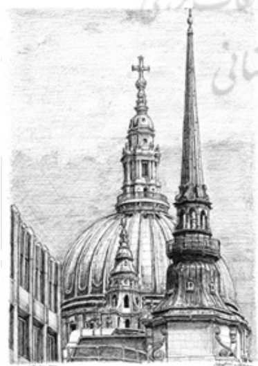
تصویر ۲. کلیسای جامع سنت پل لندن، استفان ویلتشایر (URL3).

تکرار تصاویر با حداقل تفاوت‌های قابل تشخیص، بسط آهسته، جزئیات بسیار دقیق یک تصویر، بیان وسواس‌گونه از تصاویر مرتبط به یک منطقه و موضوع محدود و مورد علاقه (که در معیارهای روان‌شناختی نقص شمرده می‌شود) را ارزشمند دانسته، به طور گسترده در آثار هنرمندانی که توسط جامعه هنری به عنوان استثنائات تولید آثار خلاقانه شناخته می‌شوند، به نمایش می‌گذارد (McKenzie, 2012:87). در ادامه این موارد در آثار این دو دسته هنرمند مورد بررسی و تحلیل قرار می‌گیرد.