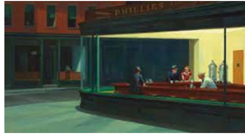
تصویر ۸. نایت هاوکز، ۱۹۴۲-۱۹۳۰.