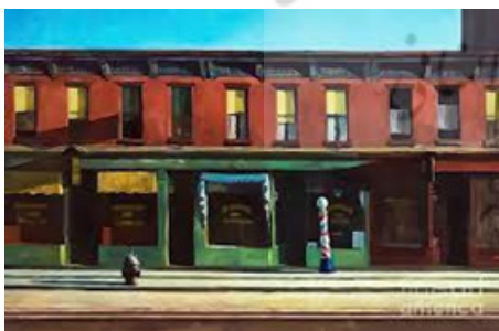
تصویر ۷. اوایل صبح یکشنبه، ادوارد هاپر، موزه هنر آمریکایی ویتنی، نیویورک، ۱۹۳۰ (URL10).

نداشتن تعامل اجتماعی و انزوا از دیگر مواردی است که به‌عنوان علائم اوتیسم معرفی می‌شود. ادوارد هاپر ۲۵ (۱۸۸۲-۱۹۶۷)، که نماینده موج بر خاسته علیه نفوذ هنر فرانسوی در آمریکا بود (ملک‌زاده، ۱۳۸۹) را می‌توان از جمله هنرمندانی دانست که از این نقص جهت ارتباط با دنیای نوروتیپیکال استفاده کرد. اگر چه هیچ تشخیص رسمی برای تعیین هاپر به‌عنوان یک اتیستیک بزرگسال وجود ندارد، با این حال، شاخص‌های زیادی در کار، فرآیندها و زندگی شخصی‌اش وجود دارد که به‌شدت نشان می‌دهد که او در این طیف بوده است. گیل لوین، نویسنده زندگی‌نامه ادوارد هاپر، می‌نویسد: «ادوارد در دوران نوجوانی نشانه‌هایی از طبیعت درون‌گرا نشان داد که در بزرگسالی به علامت شاخص او تبدیل شد. او بسیار خجالتی بود و بیان کلامی احساسات و عقایدش برایش مشکل بود. وقتی در خانه تنها می‌ماند، محیط را تهدیدآمیز می‌یافت و در اتاق خواب یا اتاق زیر شیروانی پنهان می‌شد. این شرایط سبب شد او به کارهای انفرادی پناه برد و در هنر توانایی منحصر به فردی پیدا کند تا با اعتماد به نفس با جهان و شرایط نزدیک به خودش برخورد کند» (Levin, 2007:76). مضامین کارهای هاپر شامل فضای باز، نور یکنواخت، سکون، تکرار، روابط و