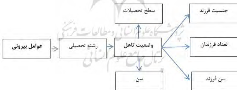
شکل ۱. شبکه‌ی عوامل بیرونی موجد مادربودگی

یافته‌های حاصل نشان می‌دهد تجارب مادرانگی زنان موسیقیدان از موسیقی فولکلور شرق خراسان تحت تأثیر عوامل گوناگونی، مانند سن، سطح تحصیلات، رشته‌ی تحصیلات دانشگاهی، جنسیت فرزند، وضعیت تأهل و سن فرزند قرار دارد. به بیانی روایت مشارکت‌کنندگان موید این است که متغیرهای عینی (بیرونی) فوق قادرند پدیدارهای مادرانگی را در مشارکت‌کنندگان تحت تأثیر قرار دهند.