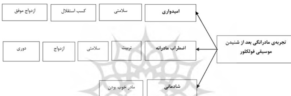
شکل ۲. مضامین و زیر مضامین تجربه‌ی مادرانگی در زنان مشارکت‌کننده

یکی از محورهای اصلی این پژوهش واکاوی و بازنمایی تجربه‌ی مادرانگی در نزد مشارکت‌کنندگان بود. ادراکی که این زنان از مادربودگی‌شان داشتند، ارتباط مستقیم و بی‌واسطه‌ای با تجارب موسیقایی آنان داشت. مصاحبه‌شوندگان قبل از هر چیز باور داشتند که موسیقی فولکلور در خود مضامین مادرانگی را دارد و این مضامین نیز به نوبه‌ی خود مؤثر در تجربه‌ی آنان در مادرانگی خودشان در حین گوش دادن به آن‌ها دارد. تحلیل روایت‌ها و گفته‌های مشارکت‌کنندگان به شناسایی سه مضمون اصلی و هشت مضمون فرعی درباره‌ی تجربه‌ی مادرانگی بعد از شنیدن موسیقی فولکلور انجامید.