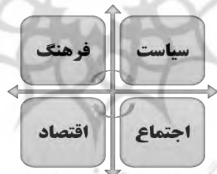
شکل ۲. مدل مفهومی پژوهش

پژوهشگر تلاش می‌کند تا با روش تئوریزه کردن و استخراج چارچوب مفهومی پژوهش خود را به پیش ببرد. در پرتو این چارچوب که حاصل فرآیند تئوریزه کردن است، پژوهشگر تلاش می‌کند تا با طراحی چارچوب مفهومی کلان پژوهش، سازه‌ها و متغیرهای لازم برای پژوهش را شناسایی نموده، سپس پروتکل پژوهش را بر اساس تحلیل داده‌ها به صورت عمیق به نتیجه برساند. در کلی‌ترین قالب قابل تصور پیشینی و به مثابه محورهای کلیدی می‌توان طرف‌ها یا خرده سیستم‌هایی را در این مسئله از یکدیگر متمایز نمود. تأثیرات دائمی و دیالکتیکی هر یک از این طرف‌ها در بازه زمانی مورد نظر می‌تواند در دستور کار پژوهشگر قرار بگیرد. لذا در این پژوهش با الهام از نظریه سیستمی، تحقق پدیده‌های گوناگون را مترتب بر نوع کنش گری خرده سیستم‌ها و شیوه ارتباط آن‌ها با یکدیگر می‌باشند. این قالب کلان جهت سازمان‌دهی در مقام شکار داده‌ها و حتی مقام داوری در تصویر زیر قابل مشاهده می‌باشد.