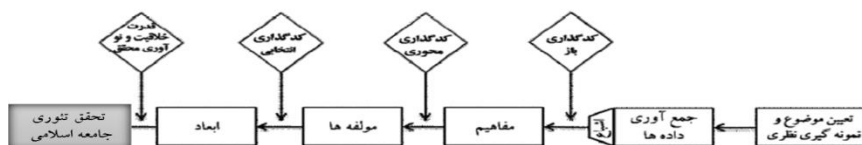
شکل ۱. فرآیند روشی پژوهش

جمع‌آوری داده‌ها در نظریه پردازی داده بنیاد به شیوه ارادی انتخاب می‌گردد. مسئله پژوهش حاضر، چستی جامعه اسلامی و شاخص‌های تحقق آن بر مبنای نظریات و اندیشه‌های مقام معظم رهبری (مدظله‌العالی) با استفاده از نظریه داده بنیاد است. همان‌گونه که مشاهده می‌گردد، استفاده از نظریه داده بنیاد متنی باید به ایجاد کردن نظریه بینجامد و این مهم در تصویر نشان داده شده است. سرانجام نتیجه پژوهش حاضر رمزگذاری انتخابی در قالب یک مدل بصری بیان شده است.