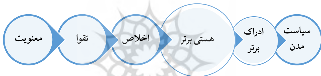
شکل ۲. مسیر نیل به هستی برتر

۱۲. معنویت، تقوا، اخلاص و اصولاً پایداری در طریقت، شریعت و حقیقت که در باور و مشی دیندارانه دین حنیف تعریف و تعیین شده است، راهی برای بازگشت به هستی برتر است که سبب ادراک برتر و سرانجام از طریق این بازگشت و ادراک به سیاست مدن از منظر فلسفی و فنای در هستی برتر از منظر عرفانی حصول پیدا می‌کند. به دلیل هم‌سنخی با شدت و در نتیجه، تجرید هستی، در اشتداد نفس و پیامدهای رفتاری آن به هستی شدیدتر، کامل‌تر، با اراده‌تر از نظر ایجابی و کم نقص‌تر و کم ضعف‌تر کمک می‌نماید.