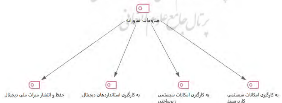
شکل ۱- خروجی مدل سلسله مراتبی کدهای محوری ملزومات فناوری از MAXQDA

نظر به چهارچوب پژوهش مبنی بر وجود ملزومات موردنیاز در تدوین خط‌مشی فراهم‌آوری منابع دیجیتال از دیدگاه ذی‌نفعان فناوری از نرم‌افزار تحلیل داده‌های کیفی MAXQDA استفاده شد.