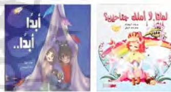
تصویر ۱. دخترانی با چهره شخصیت‌های مانگا