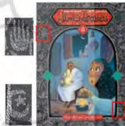
تصویر ۱۶. طرح جلد داستان قصته صارت مثل (URL 8)

گل زنبق: در جلد داستان زهور تحت نافذتی ۳ گل‌هایی شبیه به گل زنبق در لبنان دیده می‌شود که انواع آن زیاد است و به سوسن/الأرز ۴ معروف است. این گل یکی از گل‌های نادر و در معرض