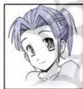
تصویر ۲. نمونه‌ای از چهره شخصیت مانگا

در طرح جلد کتاب‌های داستانی عراق، لبنان و سوریه اغلب دختران، زنان بزرگسال و سالمند با چهره شرقی و رنگ موی مشکی یا قهوه‌ای به تصویر کشیده شده‌اند. همچنین دختران در طرح جلد داستان‌های عربستان سعودی با چهره شرقی اکثریت را تشکیل می‌دهند. در دو نمونه چهره‌ها متأثر از شخصیت کارتون‌های ژاپنی (مانگا) دیده می‌شود (تصویر ۱). این طراحی اغراق‌آمیز به شخصیت‌ها امکان نمایش آزادانه‌تر احساسات را می‌دهد (تصویر ۲). زنان سالمند و بزرگسال نیز چهره شرقی دارند. در طرح جلد کتاب‌های داستانی امارات متحده عربی دختران، زنان بزرگسال و سالمند بیشتر با چهره شرقی و موهای مشکی یا خاکستری تصویر شده‌اند.