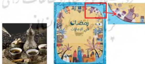
تصویر ۱۸. راست: طرح جلد داستان رمضان فی الامارات (URL 7)، چپ: نمونه‌ای از سرویس قهوه‌خوری عربی (URL 22)

سرویس قهوه‌خوری عربی: بخشی از میراث اصیل عربی و یکی از مبانی فرهنگ مهمان‌نوازی اماراتی است. امارات در این زمینه کنفرانس‌های تخصصی در صنعت قهوه را تبلیغ کرده و موزه‌های تخصصی تأسیس کرده تا تاریخ قهوه و جنبه‌های مختلف مهمان‌نوازی عرب را برجسته کند ( Al-Zahari, 2021: 3) (تصویر ۱۸). به جدول ۲ مراجعه شود.