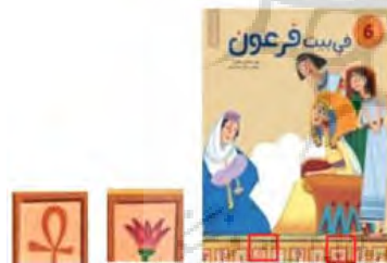
تصویر ۱۷. طرح جلد داستان فی فرعون (URL 8)

علامت هیروگلیفی «عنخ»: در تصویرسازی داستان فی‌بیت فرعون ۲ (تصویر ۱۷)، از نمادهای مصر باستان، عنخ به‌عنوان نمادی برای زندگی جاودانی به‌کار رفته است (Hall, 2018: 13). همچنین نیلوفر آبی که در مصر باستان جنبه مقدس و مورد پرستش و احترام قرار داشت (Ibid: 309).