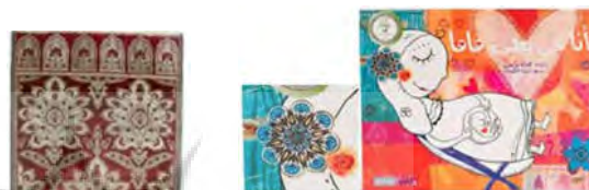
تصویر ۱۱. طرح جلد داستان آنا فی بطن ماما (URL 7)

گل لاله: در لبنان و در محیط دختران از گل لاله استفاده شده است. گل لاله نزد ترکان عثمانی به‌ویژه در نیمه دوم قرن ۱۶ و در ظروف سفالی ایزنیک رواج یافت (Allan, 1991: 74). گل لاله و میخک: در عربستان سعودی و در محیط زنان بزرگسال در طرح داستان آنا فی بطن اُمی ۱ ، گل لاله و گل میخک دیده می‌شود (تصویر ۱۱). استفاده از ترکیب این دو گل در هنر اسلامی به‌ویژه منسوجات عثمانی دیده می‌شود (تصویر ۱۲). در عراق، در طرح داستان نبی‌الله موسی ، نقوشی در تزئین قاب تصاویر به کار رفته که یادآور تزئینات مقابر فراعنه است (تصویر ۱۳ و ۱۴).