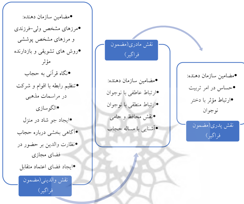
شکل ۱. مضامین فراگیر و سازمان دهنده نقش والدین در پیوست دختران نوجوان به حجاب اسلامی