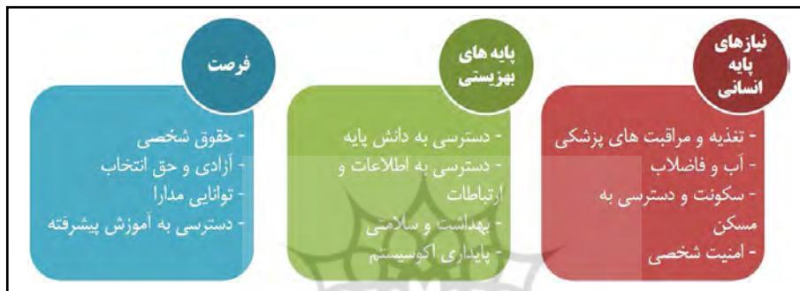
شکل ۱: اهداف و شاخص‌های پیشرفت اجتماعی (Porter et al., 2014: 28) Fig. 1: Goals and indicators of social progress (Porter et al., 2014: 28).

اقتصادی ایالات متحده آمریکا، ۲۰۰۱). «کانتی ری» (۲۰۰۸) متغیرهای توسعه اجتماعی را شامل: امید به زندگی در بدو تولد، درصد باسوادی بزرگسالان ۱۵ سال به بالا، نسبت ثبت‌نام خالص ترکیب دبستان، متوسطه و آموزش عالی، نرخ بقای نوزادان در هر ۱۰۰۰ تولد زنده، سرانه تأمین کالری روزانه، خطوط تلفن اصلی برای هر ۱۰۰۰ نفر، پزشک به ازای هر ۱۰۰۰۰ نفر و سرانه مصرف برق می‌داند (کانتی‌ری، ۲۰۰۸: ۱۷)؛ هم‌چنین «پورتر» و همکاران (۲۰۱۴) در راستای ارائه شاخص پیشرفت اجتماعی، از سه هدف پایه و زیرشاخص‌ها و متغیرهای این سه هدف، بهره برده‌اند (شکل ۱).