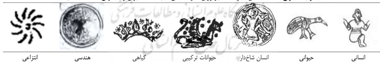
جدول ۱. انواع نقشمایه‌های اجرا شده بر روی سرسنجاق‌ها (سالک اکبری و دیگران، ۱۳۹۸: ۷۵)

با تمامی تفاوت‌های ظاهری نقش‌مایه‌های اجرا شده بر روی این سرسنجاق‌ها تمامی آن‌ها دارای یک اشتراک بوده و آن «الگوی مکانی» اجرای نقش‌مایه‌ها بر روی سرسنجاق‌ها است. به این شکل که یک نقش‌مایه در مرکز این سرسنجاق‌ها قرار گرفته است که عمدتاً منفرد و برجسته نسبت به سایر نقوش بوده و سایر نقش‌مایه‌ها به صورت قرینه نسبت به این نقش و در چپ و راست/ بالا و پایین آن اجرا شده‌اند (طرح ۱). یعنی نقوش بر روی سرسنجاق‌ها بر اساس این قاعده کلی ایجاد شده‌اند: یک نقش در مرکز به عنوان نقش مرکزی (Yها) و نقوش دیگری که در پیرامون نقش مرکزی اجرا شده و به عنوان نقوش حاشیه‌ای معرفی شده‌اند (Xها).