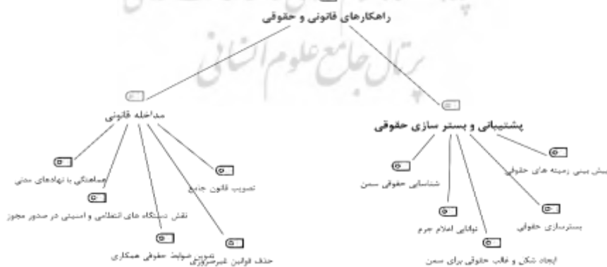
نمودار ۴- راه کارهای ارتقاء مشارکت سازمان‌های مردم‌نهاد در پیشگیری از جرائم خشن در بعد راه کارهای قانونی و حقوقی

راه کارهای قانونی و حقوقی: راه کارهای قانونی و حقوقی به عنوان یکی از راه کارهای ارتقاء مشارکت سازمان‌های مردم‌نهاد در پیشگیری از جرائم خشن شناخته شد که شامل مضامین سازمان‌دهنده‌ای، همانند مداخله قانونی و پشتیبانی و بسترسازی حقوقی بودند که در