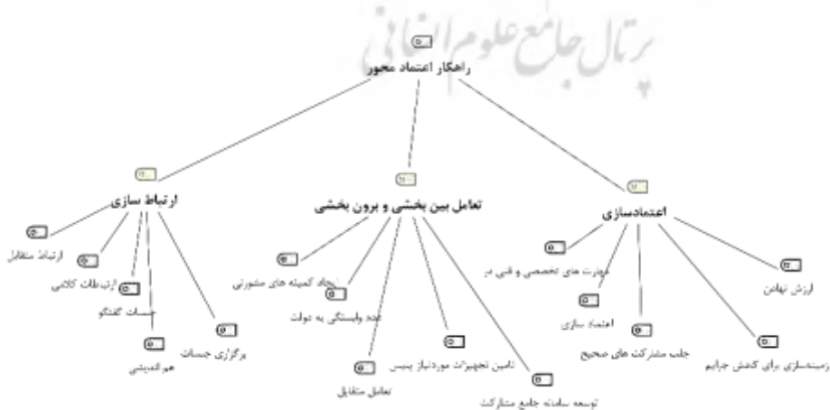
نمودار ۲- راه کارهای ارتقاء مشارکت سازمان های مردم نهاد در پیش گیری از جرائم خشن در بعد راه کارهای اعتماد محور

بودند که در نمودار زیر مضامین فراگیر، مضامین سازمان دهنده و مضامین پایه ناشی از تحلیل مضمون در راه کارهای ارتقاء مشارکت سازمان های مردم نهاد در پیش گیری از جرائم خشن در بعد راه کارهای اعتماد محور به صورت زیر گزارش شده است: