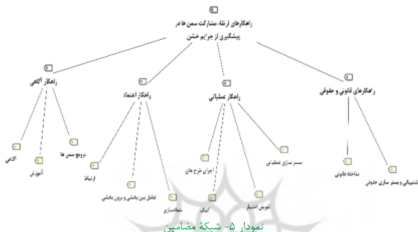
نمودار ۵- شبکه مضامین