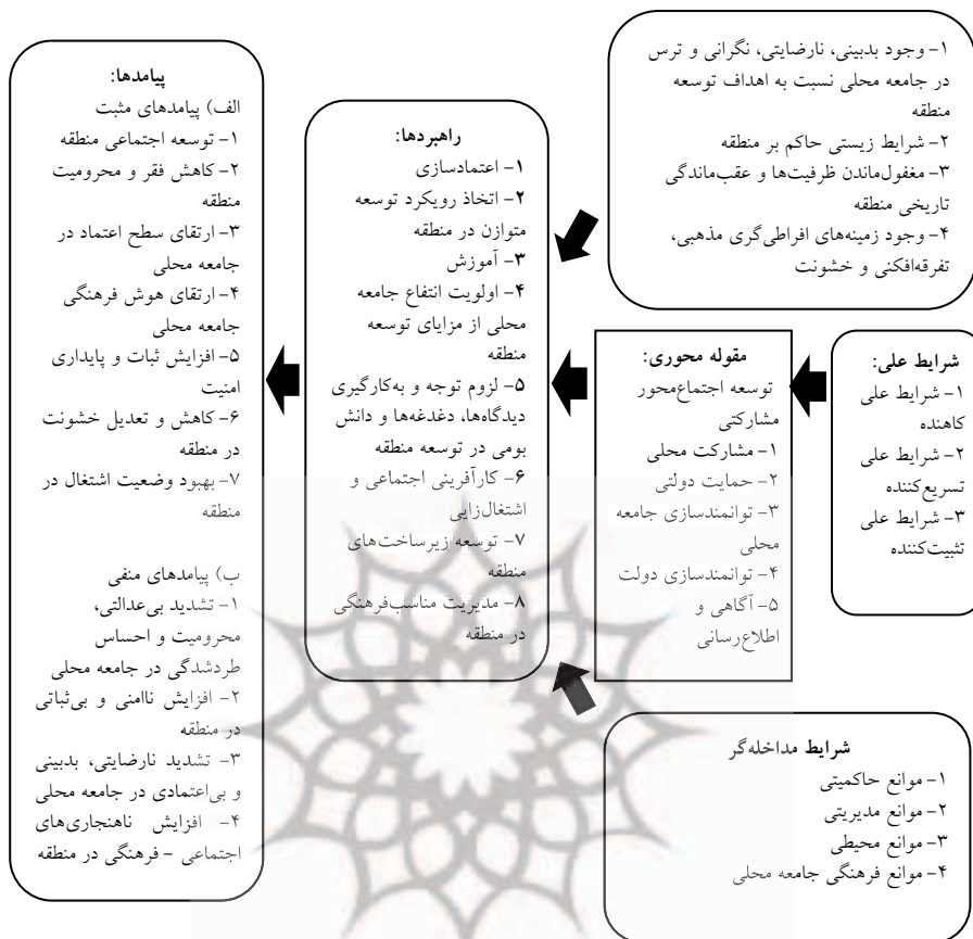
شکل ۲- چهارچوب پایداری اجتماعی - فرهنگی توسعه دریامحور سواحل مکران