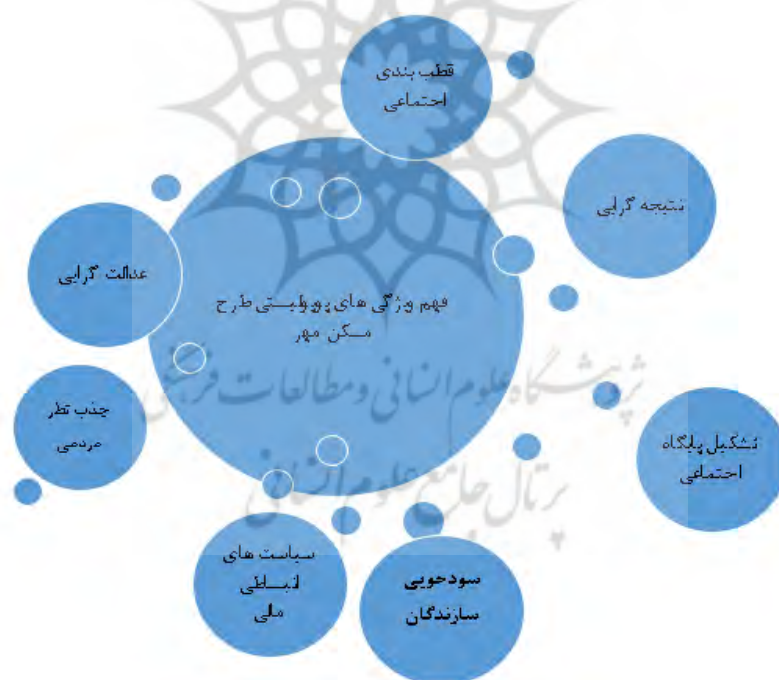
شکل ۱- ویژگی‌های معرف ملاحظات پوپولیستی در طرح مسکن مهر با تأکید بر تهیه، اجرا و روند طرح

نشان می‌دهد که برخی ملاحظات پوپولیستی در تدوین و ارائه طرح‌های مرتبط با توسعه شهرها، به سبب تأکید بیش از حد بر مردم و توده‌ای کردن جامعه از یک سو و ضدیت با نخبگان و ساختار سیاسی - اجتماعی موجود، بیش از آنکه با هدف تأمین مسکن صورت گرفته باشد، متکی بر لفاظی رهبر پوپولیست، تأکید صرف بر خواست عمومی مردم و در واقع به عنوان ابزاری برای سیاست‌گذاری جهت بسیج مردمی در بسترهای سیاسی، اقتصادی و اجتماعی، است. به گونه‌ای که یافته‌های تحقیق حاضر نشان از آن دارد که در مجموع ۲۲ کد و مفهوم شناسایی شده در قالب ۱۵ مقوله محوری تبیین شده، ۷ ویژگی و خصیصه معرف ملاحظات پوپولیستی در تهیه، اجرا و روند آن، قابل ردگیری است (شکل شماره ۱). قطب‌بندی اجتماعی، نتیجه‌گرایی (تأکید بر بازدهی سریع و نتیجه بجای کیفیت‌گرایی)، تشکیل پایگاه اجتماعی، سودجویی سازندگان، سیاست‌های انبساطی مالی (منجر به تورم و رکود)، جذب نظر مردمی و عدالت‌گرایی، در این زمینه، قابل شناسایی و تبیین هستند.