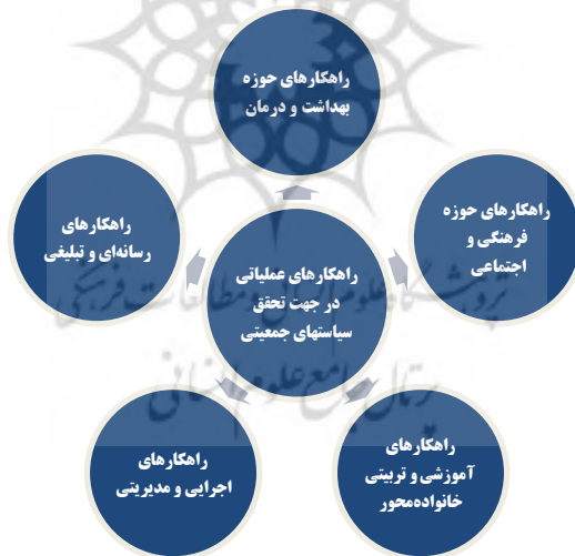
شکل (۲): دسته‌بندی راهکارهای عملیاتی در جهت تحقق سیاست‌های جمعیتی

پس از احصاء مسائل و خلأهای موجود در قانون و چالش‌ها و موانع اجرای قانون، مهم‌ترین راهکارهای عملیاتی متناسب با نظام مسائل حوزه جمعیتی در استان ضمن گفتگو و مصاحبه با کارشناسان و نخبگان حوزه مطالعات جمعیتی استخراج و در پنج حوزه مورد نظر ذیل، جهت کاربرست در حوزه سیاست‌گذاری جمعیتی و رفع موانع تحقق و اجرای سیاست‌های جمعیتی و قانون حمایت از خانواده، ارائه گردید.