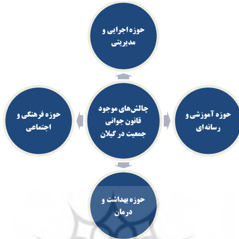
شکل (۱): مجموعه مقولات «چالش‌های موجود قانون جوانی جمعیت در گیلان»