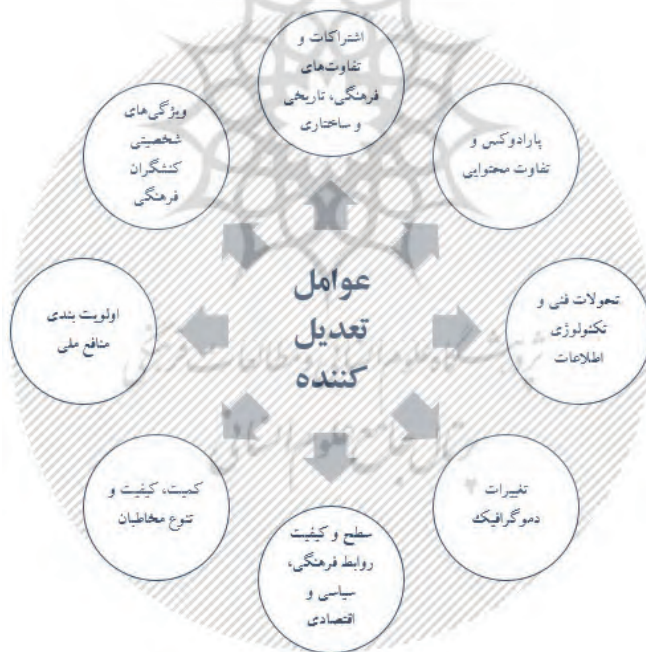
شکل ۶- تعدیل‌ترهای مداخله‌گر در راهبردهای دیپلماسی فرهنگی ج.ا.ایران

کاستی‌ها و ضعف‌هایی که در محیط داخلی وجود دارد نیز از جمله مواردی بود که توسط مشارکت‌کنندگان به عنوان مؤلفه تأثیرگذار بر اقدامات و راهبردها مطرح شد.