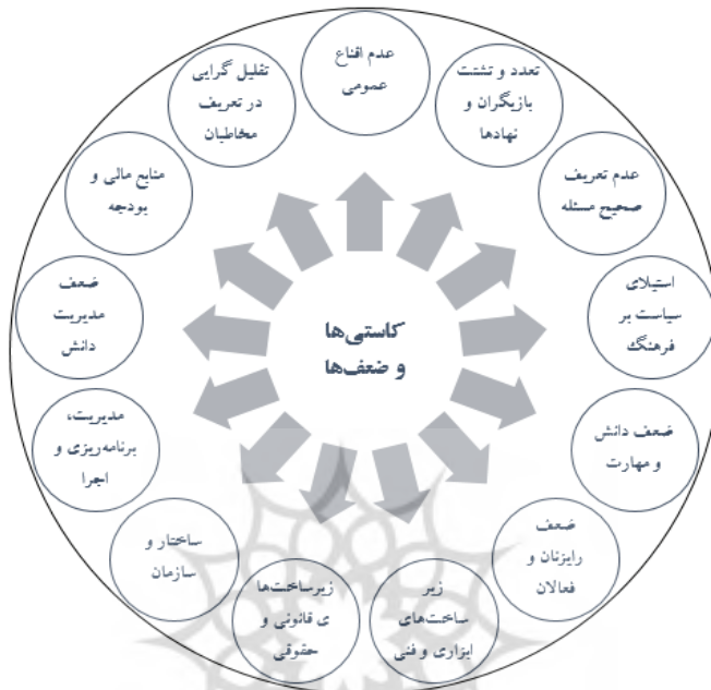
شکل ۷- کاستی‌ها و نقاط ضعف مداخله‌گر در راهبردهای دیپلماسی فرهنگی ج.ا.ایران

محدود و یا به عموم مردم و مخاطبان مختلف کمتر پرداخته شده است. این امر، خود تابعی از محدودیت‌های انسانی و مالی است.