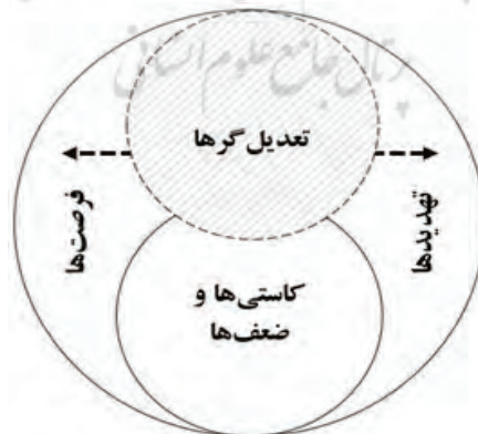
شکل ۲ - چهارچوب مفهومی عوامل مداخله‌گر در راهبردهای دیپلماسی فرهنگی ج.ا.ایران

عوامل مداخله‌گر در میدان اجرای دیپلماسی فرهنگی، همواره از عواملی هستند که اجرای راهبردهای دیپلماسی فرهنگی را تحت تأثیر قرار داده و بر انتخاب، شدت و ضعف هر یک و یا میزان اثرگذاری آن تأثیر دارند. برخی از این عوامل به بافت محیط برمی‌گردد و شکل تهدید و فرصت به خود می‌گیرد؛ و برخی دیگر نیز در سازوکار و بافت درون دیپلماسی فرهنگی است و در نتیجه، ضعف‌های خود را نشان می‌دهد. برخی موارد نیز حالت بینابینی دارند و عوامل تعدیل‌گر شناخته می‌شوند.