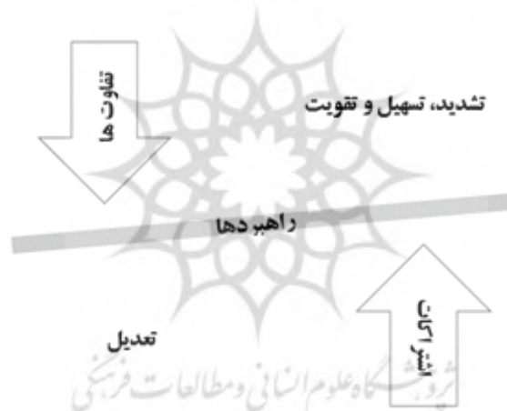
شکل ۵- تأثیر اشتراک‌ها و تفاوت‌های فرهنگی، تاریخی و ساختاری بر راهبردهای دیپلماسی فرهنگی

برخی از افراد، نقش پارادوکس و تفاوت محتوایی را که در مفاهیم و اقدامات دیپلماسی فرهنگی وجود دارد، مطرح نمودند. اولین نکته مورد اشاره، تفاوت تعریف از فرهنگ و عناصر و مؤلفه‌های آن میان ایران و برخی کشورها است. مثلاً جمهوری اسلامی ایران مؤلفه دین را فرهنگی می‌داند؛ اما کشورهای سکولار، نگاه متفاوتی به این مؤلفه دارند. به علاوه، یک دوگانگی‌هایی در اقدامات دیپلماسی فرهنگی وجود دارد. برای نمونه، دیپلماسی تقریبی و وحدت اسلامی با دیپلماسی شیعه‌گرایی و یا زاویه‌ی نگاه تمدنی با نگاه اسلامی و انقلابی به دیپلماسی فرهنگی از جمله پارادوکس‌ها و چالش‌های دیپلماسی فرهنگی