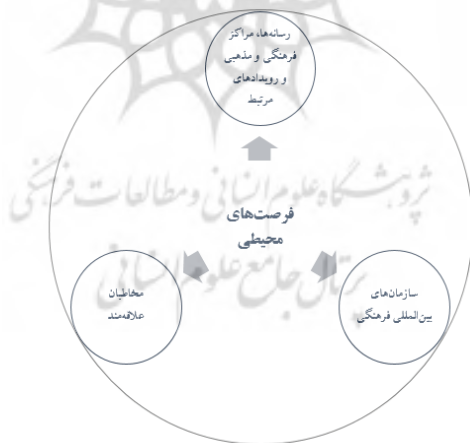
شکل ۴- فرصت‌های محیطی، مداخله‌گر در راهبردهای دیپلماسی فرهنگی ج.ا.ایران