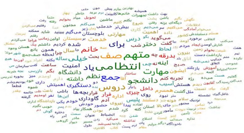
شکل ۲: ابروازگان روایت پژوهی یک پلیس زن موفق در نظام جمهوری اسلامی ایران، خروجی نرم افزار اطلس تی آی