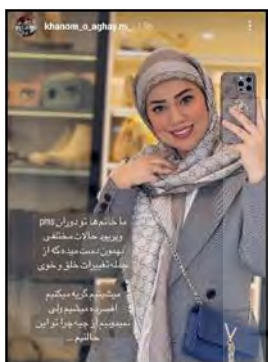
تصویر ۲- استوری درج‌شده در صفحه بلاگر خانم و آقای میم

عکاسی به نام روپی کار ۱ (2015) در اینستاگرام خود مجموعه‌ی عکسی با نام دوره‌ی زمانی ۲ آپلود کرد. زنی در تخت خوابیده، دو لکه‌ی خون قاعده روی لباس و تخت است. او با این کار قاعدگی را نه پنهان کرد و نه انگ زد، بلکه بدنی را نشان داد که در حال خونریزی است و قوانین رفتار اجتماعی را در قبال قاعدگی به چالش کشید. این عکاس امر شخصی را سیاسی کرد که بخشی از زندگی روزمره بود. هیچ امری شخصی نیست و بار اجتماعی مسئله در ارتباط با دیگران به چشم می‌خورد.