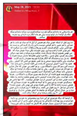
تصویر ۱- استوری درج‌شده محقق در اینستاگرام

تصویر ۱ اولین استوری‌ای بود که در «روز جهانی بهداشت قاعدگی»، ۲۸ می سال ۲۰۲۱ در صفحه اینستاگرام خود به اشتراک گذاشتم. من پیام را صادر کرده بودم و می‌خواستم دورنمای خیلی عادی را از این قضیه نشان دهم. پرپود چیست و چرا برای زنان که هر ماه با آن درگیر هستند، هیچ وقت عادی نمی‌شود؟ توضیح ساختار علمی پرپود و مشترک‌بودن این ساختار در بین تمام زنان اعصار تاریخ و نترسیدن از آن می‌تواند راهگشای قضیه باشد. قاعدگی به‌عنوان نشانه‌ای از بلوغ و باروری شناخته می‌شود و پذیرش این تجربه بدون ترس و شرم نقش بنیادینی در شکل‌گیری زنانگی و هویت آنان دارد.